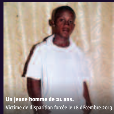
Un jeune homme de 21 ans. Victime de disparition forcée le 18 décembre 2013.