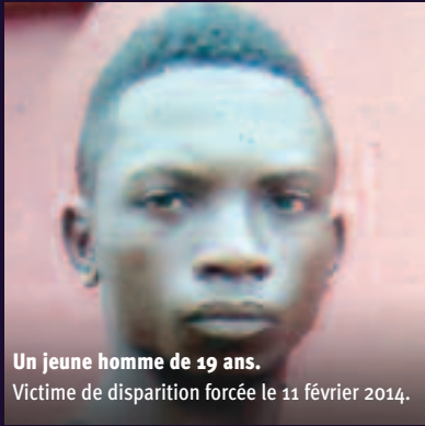
Un jeune homme de 19 ans. Victime de disparition forcée le 11 février 2014.