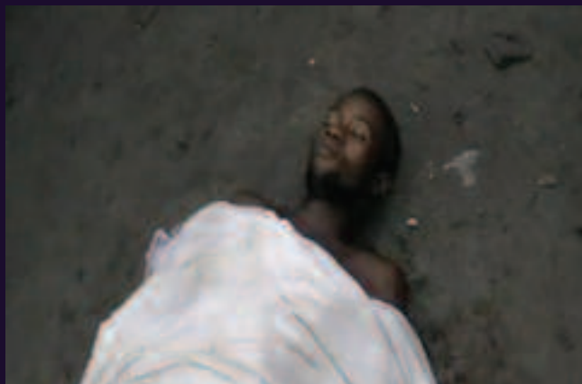
Commune de Bumbu, Kinshasa. 18 novembre 2013.