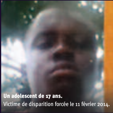
Un adolescent de 17 ans. Victime de disparition forcée le 11 février 2014.