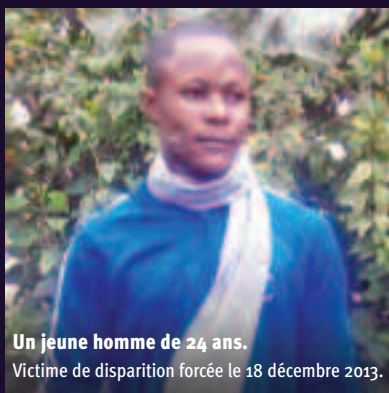
Un jeune homme de 24 ans. Victime de disparition forcée le 18 décembre 2013.