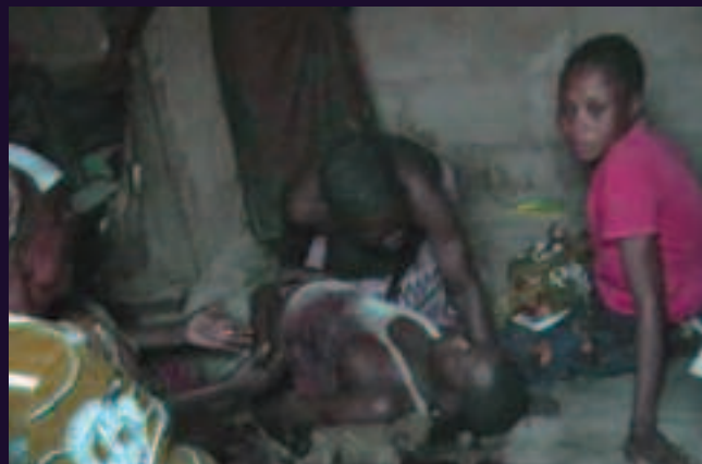
Commune de Masina, Kinshasa. 20 novembre 2013.