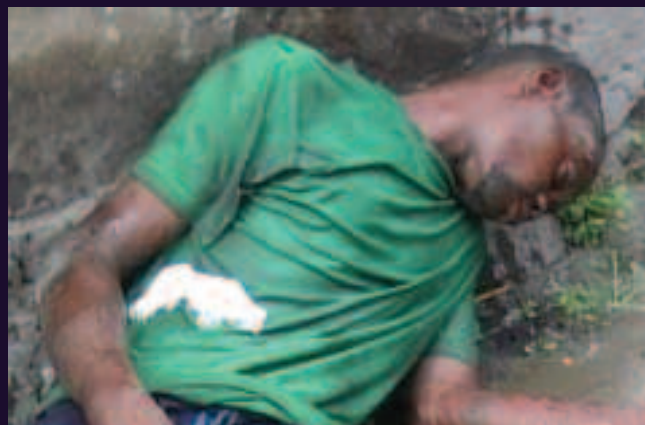
Commune de Masina, Kinshasa. 23 novembre 2013.