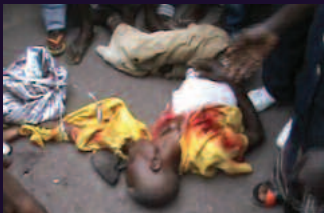
Commune de Masina, Kinshasa. 21 novembre 2013.