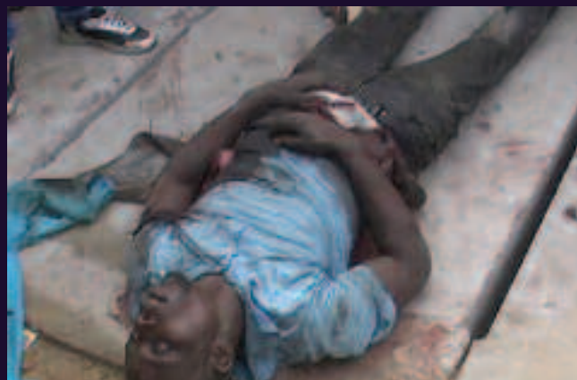
Commune de Kalamu, Kinshasa. 21 novembre 2013.