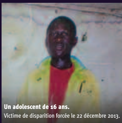
Un adolescent de 16 ans. Victime de disparition forcée le 22 décembre 2013.