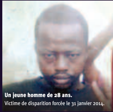
Un jeune homme de 28 ans. Victime de disparition forcée le 31 janvier 2014.