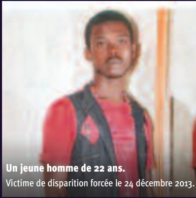
Un jeune homme de 22 ans. Victime de disparition forcée le 24 décembre 2013.