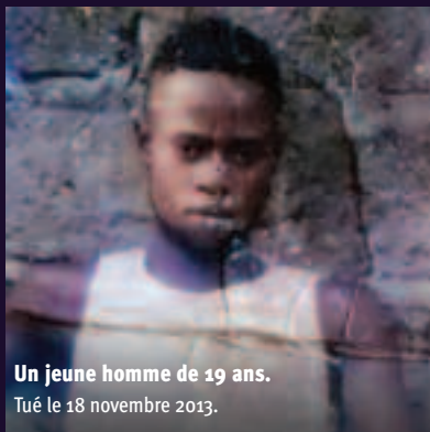
Un jeune homme de 19 ans. Tué le 18 novembre 2013.