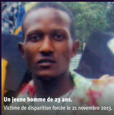
Un jeune homme de 23 ans. Victime de disparition forcée le 21 novembre 2013.