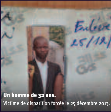
Un homme de 32 ans. Victime de disparition forcée le 25 décembre 2013.