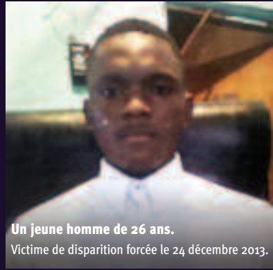
Un jeune homme de 26 ans. Victime de disparition forcée le 24 décembre 2013.