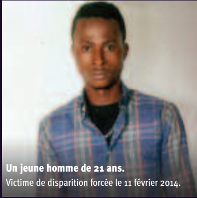
Un jeune homme de 21 ans. Victime de disparition forcée le 11 février 2014.