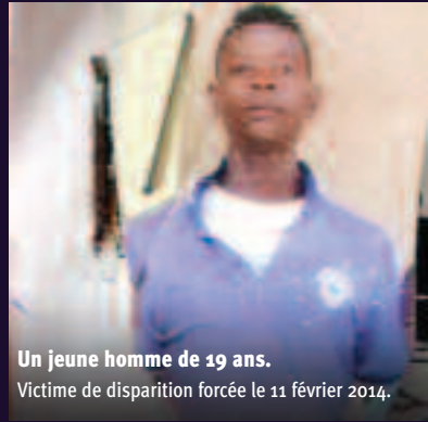
Un jeune homme de 19 ans. Victime de disparition forcée le 11 février 2014.