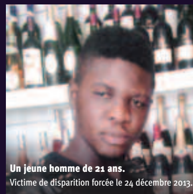
Un jeune homme de 21 ans. Victime de disparition forcée le 24 décembre 2013.