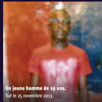
Un jeune homme de 19 ans. Tué le 25 novembre 2013.