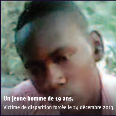
Un jeune homme de 19 ans. Victime de disparition forcée le 24 décembre 2013.