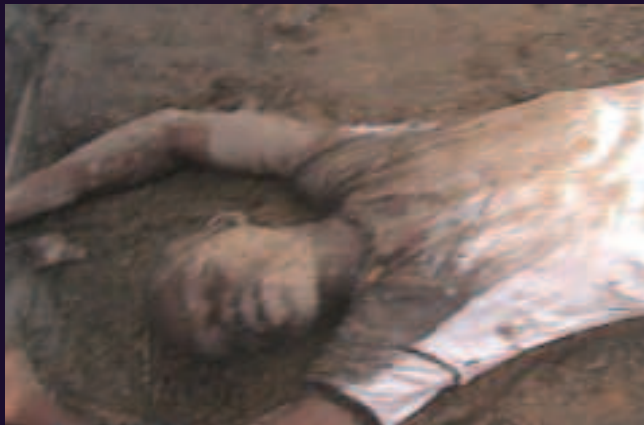
Commune de Masina, Kinshasa. 25 novembre 2013.