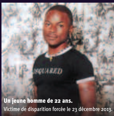
Un jeune homme de 22 ans. Victime de disparition forcée le 23 décembre 2013.