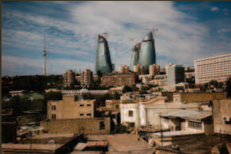
Alov Qüllələri Bakıdakı yeni tikililərin simvoluna çevrilib.

Bakının mərkəzində söküntü və məcburi özünüküləşdirilmə hallarının açıq şəkildə Azərbaycan Respublikasının milli qanunvericiliyini və beynəlxalq insan hüquqları qanunlarını pozduğunu nəzərə alaraq, Bakının mərkəzi hissələrində bu işlərin nəyə görə icraatına icazə verilməsinə dair Baş Prokurorluq müstəqil istintaq araşdırmasına başlamalıdır.