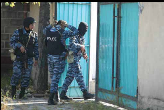
Антитеррористическое подразделение во время обыска в Бишкеке 16 октября 2015 г.

Преследование за хранение экстремистских материалов характерно для всех государств Центральной Азии, власти которых стремятся не допустить укоренения в регионе вооруженных экстремистских группировок, таких как «Исламское государство». Мы признаем обязанность любого правительства обеспечивать защиту всем лицам в пределах его юрисдикции, однако нарушения прав человека при этом недопустимы и могут обернуться отчуждением между властью и местными сообществами.