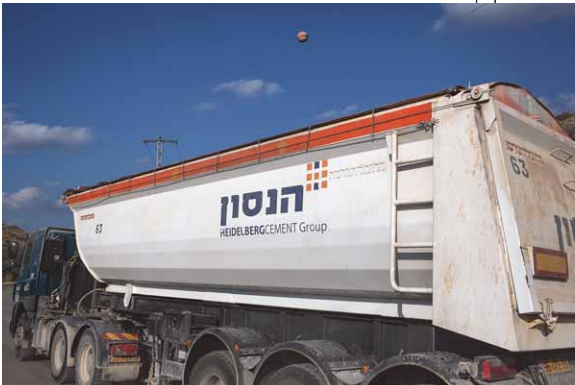
משאית של קבוצת היידלברג צמנט יוצאת ממחצבת נחל רבה

על-פי נתונים שסיפקה חברת היידלברג לארגון Human Rights Watch, חברת הנסון שילמה בשנת 2014 כ-3.25 מיליון אירו בתור תמלוגים למנהל האזרחי הישראלי, ו-430 אלף אירו נוספים כמסים מוניציפליים למועצה האזורית שומרון בגין הפעלת מחצבת נחל רבה. 109 חברת היידלברג הגנה על פעילותה בטענה שהיא עולה בקנה אחד באופן מלא עם הוראות המשפט הבינלאומי כיוון שהקרקע לא הייתה בבעלות פרטית, והדגישה שהתמלוגים שהיא משלמת לישראל מועברים למנהל האזרחי "לטובת תושבי שטח C". כמו כן ציינה החברה שהיא מעסיקה 36 פלסטינים תושבי הגדה המערבית, המקבלים אותן זכויות סוציאליות ומשכורות כמו עמיתיהם הישראלים, וכי 25 פלסטינים נוספים עובדים באתר מדי יום באמצעות קבלן משנה.