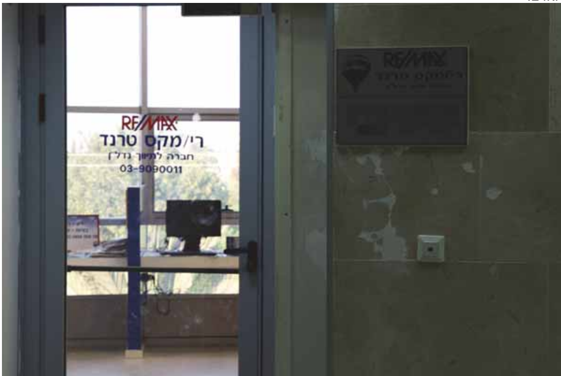
רי/מקס טרנד, סניף של רשת נדל"ן שבסיסה בקולרדו, פועל בזיכיון בראש העין. הסניף מוכר ומשכיר בתים בהתנחלות אריאל. לרי/מקס יש גם סניף בהתנחלות מעלה אדומים

הן הזכינית הישראלית של רי/מקס והן רי/מקס בע"מ, בעליה של רשת הזיכיונות ברחבי העולם, מסייעות להעברת אזרחים ישראלים לתוך השטח הכבוש ולהפרת זכויות האדם הקשורה בכך, על-ידי פרסום, מכירה והשכרה של בתים בהתנחלויות, ונהנות מהפרות אלה, בניגוד למחויבויותיהן בתחום זכויות האדם.