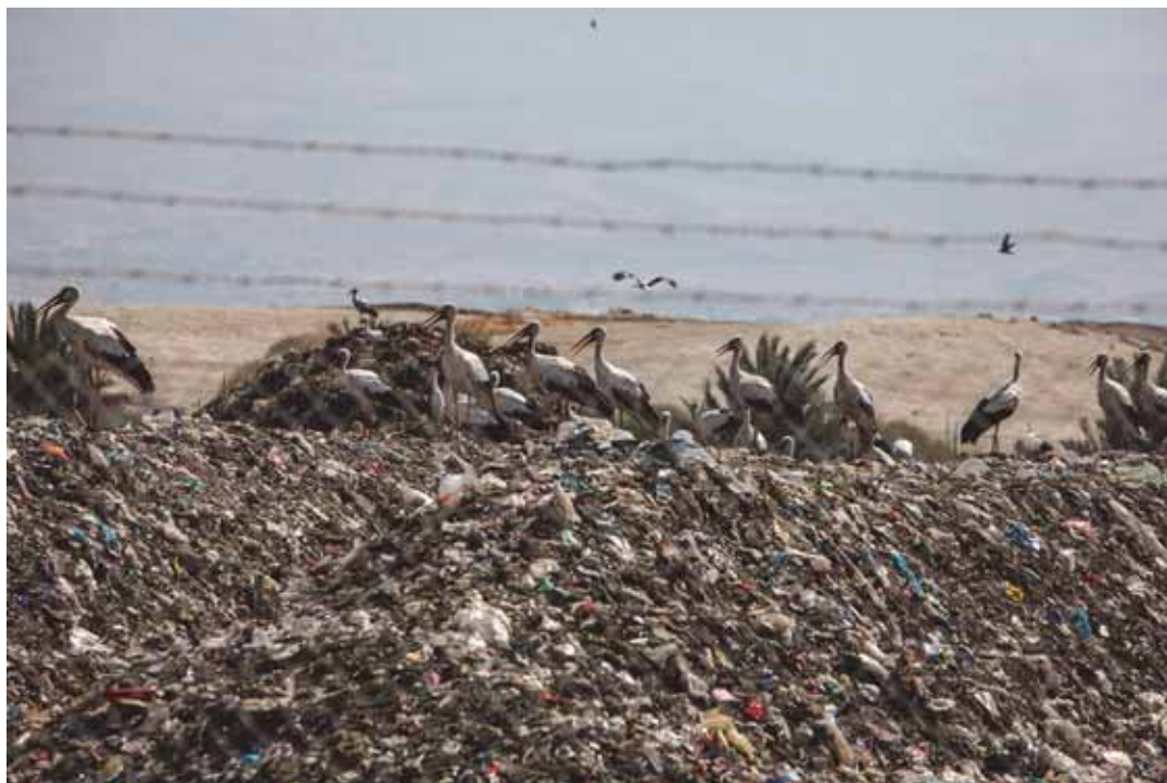
חסידות עומדות על ערמת פסולת במטמנה בבקעת הירדן. המטמנה, הממוקמת בגדה המערבית, משרתת באורח בלעדי את ישראל וכמה התנחלויות

השפעתן המזיקה של התנחלויות ישראליות ושל תושביהן מגעת מעבר לתחום הקרקע שעליה מוצבים בתיהם. התנחלויות זקוקות לכבישים, מערכות תחבורה, שירותי טלקומוניקציה ומוצרים ושירותים אחרים. חברות פרטיות מספקות רבים מהצרכים הללו, ובכך הן תורמות להשתלטות הבלתי חוקית של אדמות ומשאבים פלסטיניים. חברות אלה גם מאפשרות את נוכחותן של ההתנחלויות בכך שהן הופכות אותן לבנות קיימא. ארגון Human Rights Watch סבור כי עסקים המשרתים התנחלויות נהנים לעתים קרובות מהמדיניות ומדפוס הפעולה של ישראל המפלים פלסטינים לרעה ופוגעים בהם, בשעה שהם מעניקים למתנחלים זכויות יתר. לדוגמה, חברות אלה, כמו כל עסקי ההתנחלויות, פועלות בשטח הנתון לשליטה צבאית ולפיכך הן זקוקות לאישור של המנהל האזרחי כדי לפעול. ישראל מחלקת היתרים אלה באורח מפלה, כשהיא מנפיקה בחפץ לב היתרים לעסקים המספקים שירותים להתנחלויות, ואילו לעסקים דומים המשרתים פלסטינים היא מנפיקה היתרים כאלה רק לעתים נדירות, אם בכלל. עסקים הממוקמים בהתנחלויות גם מסייעים לקיימות הכלכלית באמצעות תשלום מסים לשלטון המקומי שלהן ואספקת משרות למתנחלים, בין אם פעילותם כוללת מתן שירותים ישירים למתנחלים ובין אם לאו.