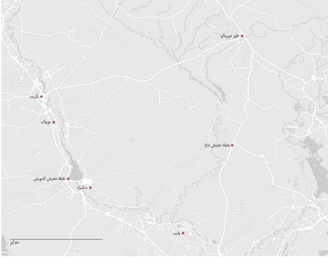
خريطة تظهر مواقع اعتقال فيها الأشخاص ثم تم إخفاؤهم.

کردستان ومجموعة من قوات الحشد الشعبي والشرطة المحلية، ومسرحا لاشتباكات متقطعة من 2014 إلى 2017. 61