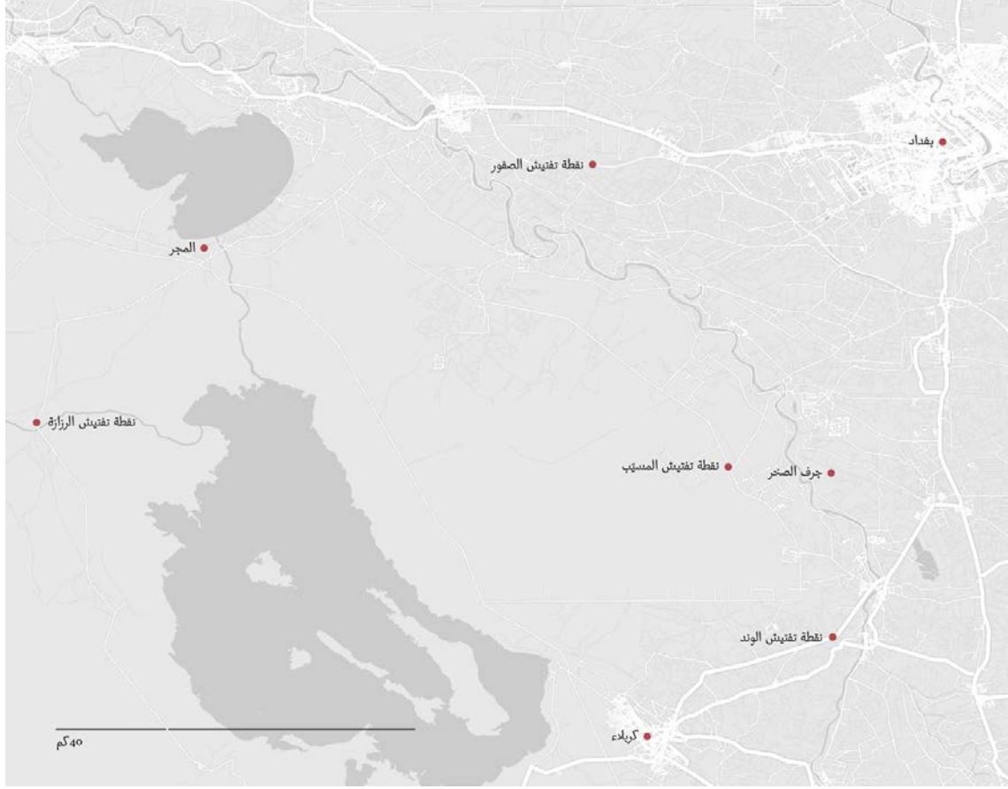
خريطة تظهر مواقع اعتقل فيها الأشخاص ثم تم إخفاؤهم.

مجلس محافظة بابل على إعادة تسمية البلدة بجرف النصر بسبب انتصار قوات الحشد الشعبي على داعش. 90 قال السكان إنه أثناء القتال الدائر بين داعش وقوات الحشد الشعبي، فر معظمهم إلى المسيب، أيضا في بابل، أو إلى إقليم كردستان العراق أو إلى بغداد.