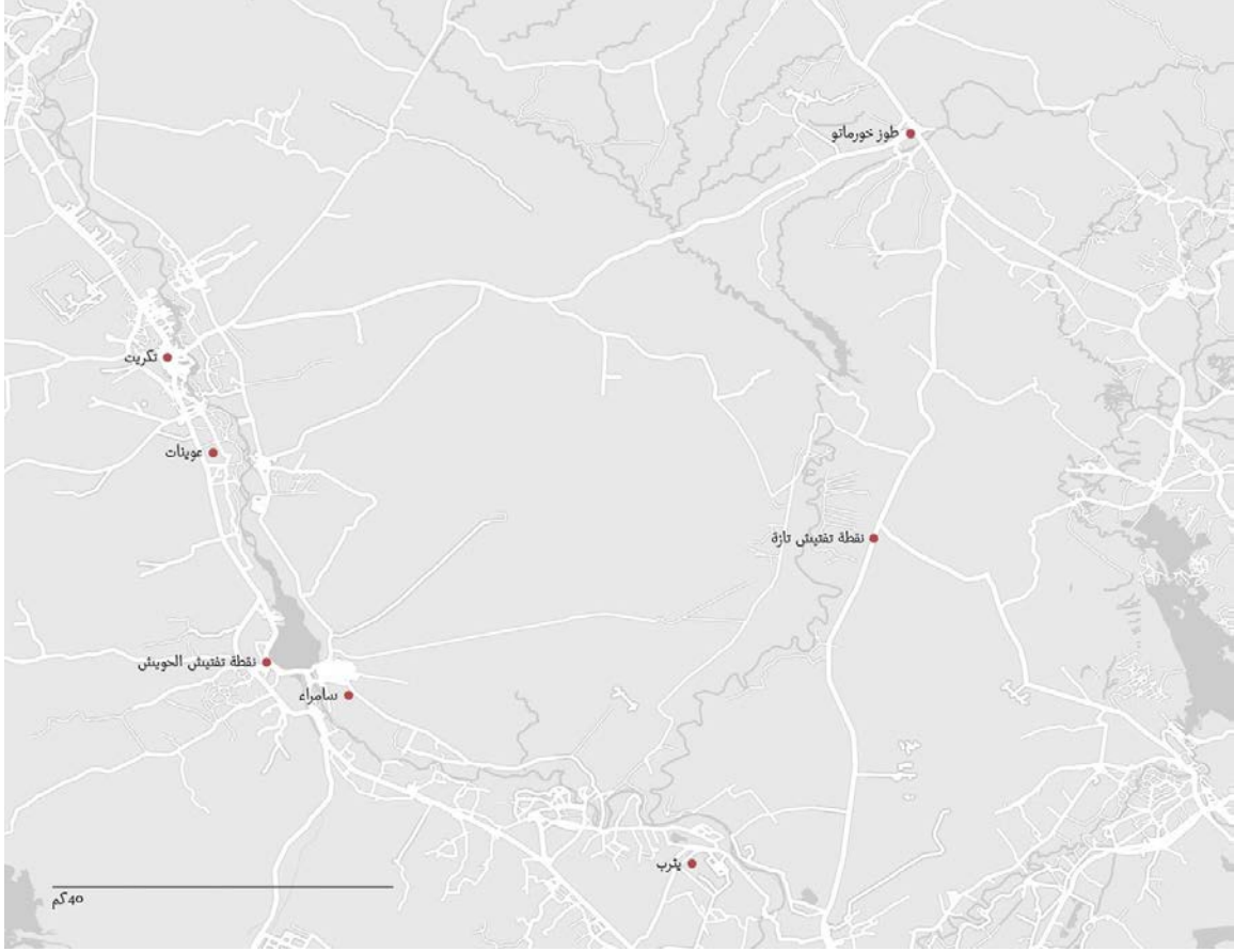
خريطة تظهر مواقع اعتقال فيها الأشخاص ثم تم إخفاؤهم.