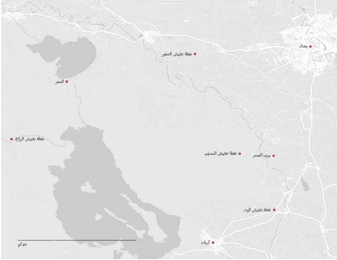
خريطة تظهر مواقع اعتقال فيها الأشخاص ثم تم إخفاؤهم.