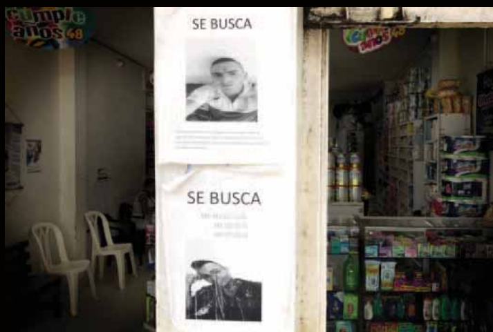
Posters pegados en un negocio en el centro de Tumaco solicitan información sobre dos hombres desaparecidos.

Este informe recomienda medidas que las autoridades colombianas deberían adoptar con urgencia para frenar los crímenes y garantizar los derechos de las víctimas. Estas incluyen medidas para enfrentar el narcotráfico y la falta de oportunidades de la población, dos factores clave que permiten que los grupos armados crezcan. También deben aumentar la cantidad de fiscales, jueces e investigadores judiciales en Tumaco.