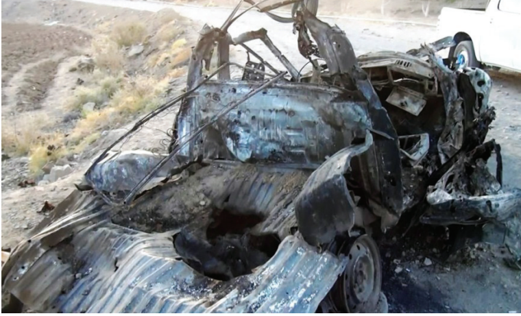
السيارة الرياضية التي أصيبت في غارة بطائرة بدون طيار في المصنعة يوم 24 يناير/كانون الثاني 2013، وقد أسفرت الضربة عن مقتل اثنين من الأشخاص المشتبه بانتمائهم إلى القاعدة في شبه الجزيرة العربية واثنين من المدنيين.