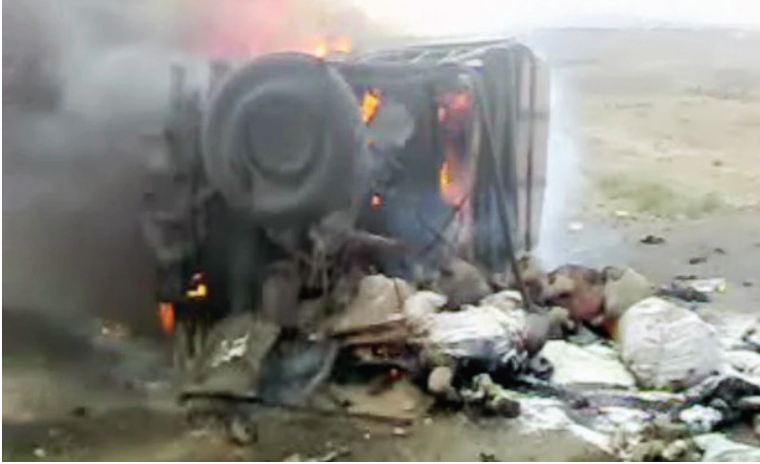
المشهد بعد غارة جوية أمريكية مباشرة على حمة صرار في 2 سبتمبر/أيلول 2012، قتلت 12 مدنيًا عاندين إلى بيوتهم من السوق.

في 2 سبتمبر/أيلول 2012، تعرضت سيارة من نوع تويوتا لاندكروزر لهجوم من طائرة حربية أو طائرة بدون طيار قرب مدينة رداع وسط اليمن. 177 وتسببت الغارة الناجمة عن صاروخ أو قنبلة في مقتل 12 من ركاب السيارة، بمن فيهم ثلاثة أطفال وامرأة حامل. كما تعرض السائق وراكب آخر إلى حروق خطيرة، ولكنهما تمكنا من النجاة. 178