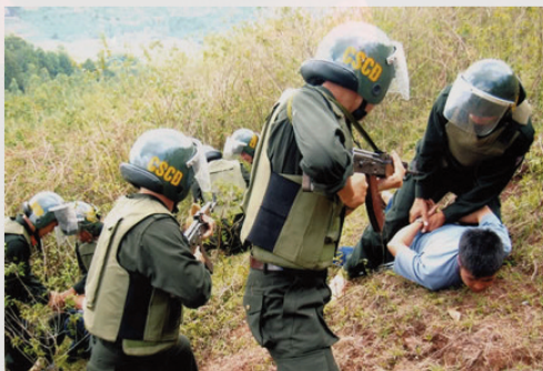
Một số hình ảnh của Đội CSCD Gia Lai.

Được lựa chọn đa phần từ CBCS ở tuổi mười tám đôi mươi của Tiểu đoàn CSCD và vị trong CA tỉnh, biên chế ban đầu của Đội chỉ 20 người. Mặc dù thời gian đầu gặp nhiều khó khăn, nhưng bằng sự thống nhất, dân chủ trong công tác lãnh đạo của chỉ huy và của CBCS, Đội CSCD ngày càng trở thành lực lượng cơ động, ứng phó kịp thời mọi tình huống xảy ra. Bên cạnh việc triển khai hàng nghìn lượt CBCS tham gia bảo vệ các cuộc họp chính trị, văn hóa, thể thao, TTATXH trong các ngày lễ, hội tại Gia Lai, cả nước, bảo vệ các đoàn khách A1 đến thăm, làm việc tại Gia Lai, Đội còn phải đảm đương nhiệm vụ trọng tâm, then chốt phối hợp với Phòng PA43, CA các địa phương thực hiện truy quét, đối tượng phản động, chống phá Nhà nước, góp phần đáng kể vào chiến công bắt gọn FULRO cốt cán cuối cùng.