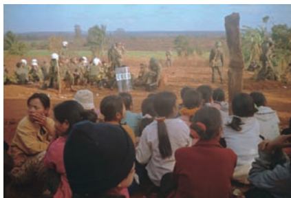
Phụ nữ Jarai làng Plei Lao, nơi cảnh sát cơ động giải tán một cuộc tụ họp cầu nguyện suốt đêm hồi tháng Ba năm 2001, nổ súng bắn dân làng – giết chết một người – và sau đó đốt nhà thờ làng