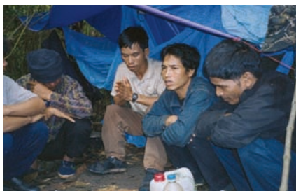
Người Thượng tị nạn ở các lán dựng tạm trong rừng Campuchia