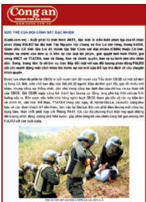
Công An Thành phố Đà Nẵng đưa tin về các chuyên án an ninh ở khu vực Tây Nguyên, trong đó Đội Cảnh sát Đặc nhiệm bắt giữ và thẩm vấn một số người bị cho là “Tin Lành Dega”

Người Thượng Cơ đốc giáo ở Việt Nam: Hồ sơ nghiên cứu một trường hợp đàn áp tôn giáo kêu gọi chính quyền Việt Nam ngay lập tức chấm dứt sự đàn áp có tính hệ thống đối với người Thượng Cơ đốc giáo và thả hết những người Thượng bị giam giữ về các hoạt động tôn giáo hoặc chính trị một cách ôn hòa.