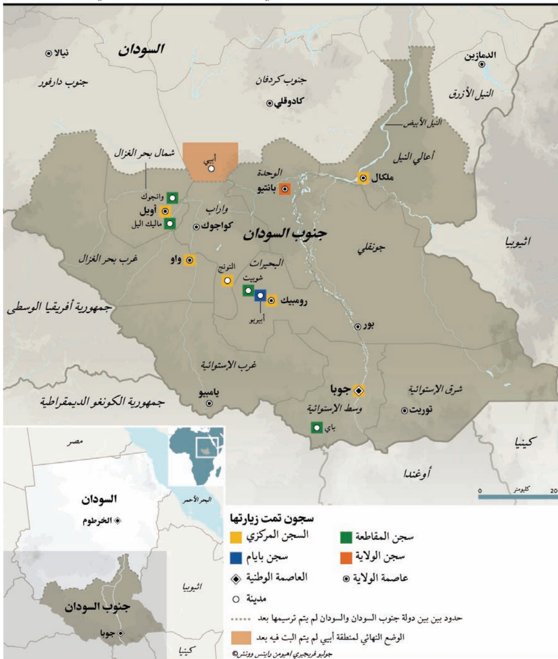
السجون التي زارتها هيومن رايتس ووتش في جنوب السودان