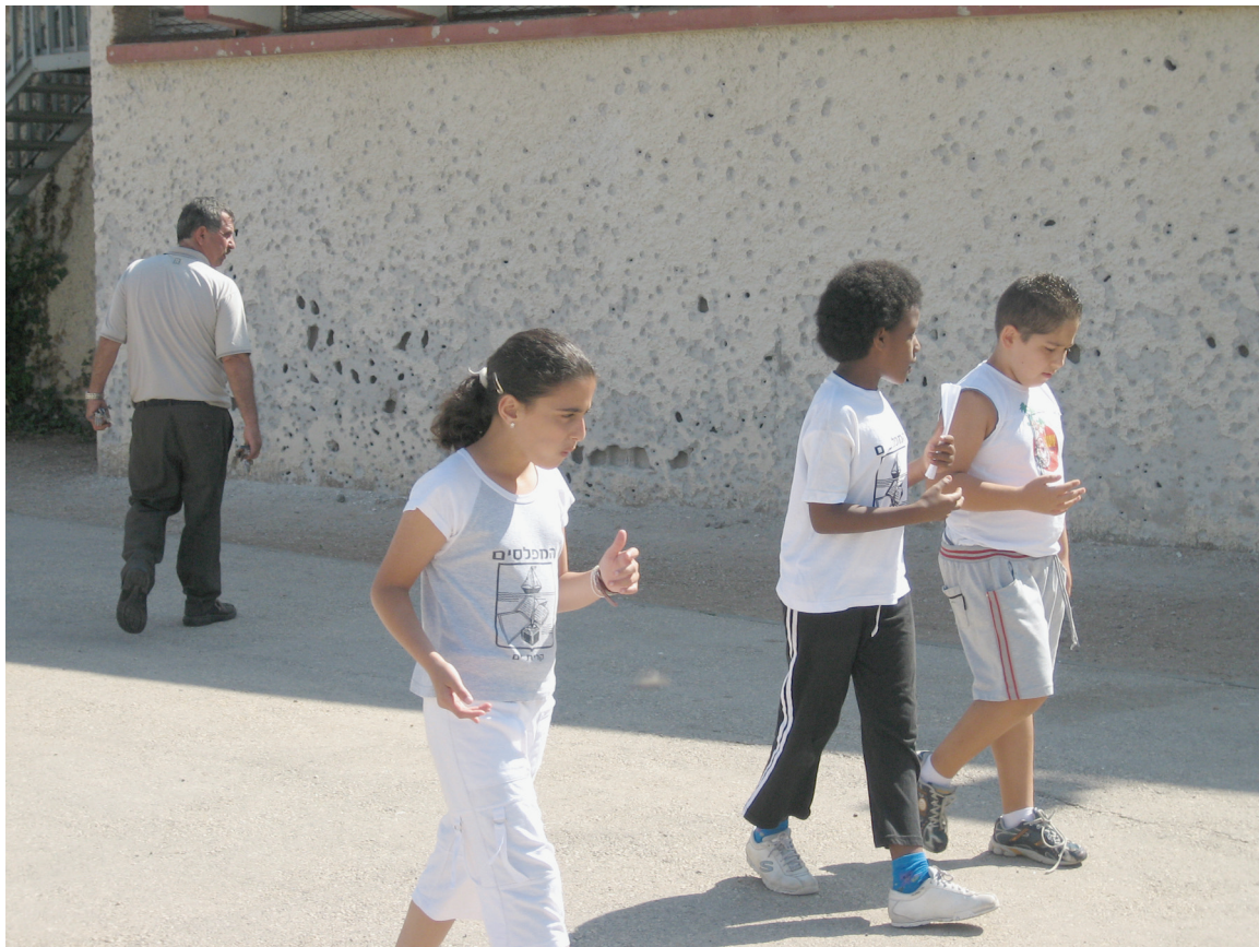
קיר בבית הספר היסודי "המפלסים" בקריית ים, שניזוק מפגיעת גולות פלדה שניתזו מרקטה אשר פגעה בכיתה סמוכה ב-13 באוגוסט 2006, © 2006 בוני דוקרטי / ארגון Human Rights Watch

התקפות חיזבאללה על מתחם רפאל אין בהן כדי להסביר את הפיזור הנרחב וחסרת ההבחנה של נחיתת הרקטות ברחבי קריית ים. למיטב ידיעתנו, בעיר לא נמצאו שום מטרות צבאיות משמעותיות אחרות במהלך המלחמה. תפרוסת התקפות הרקטות ברחבי העיר, ששטחה חמישה קמ"ר, בהנחה שתצלומי האוויר של העיר המוצגים באתר העירייה מייצגים אותה נכונה, אינה מותירה ספק רב באשר לשאלה האם חיזבאללה ירה ללא הבחנה, אפילו אם אכן קיווה לפגוע במתחם רפאל.