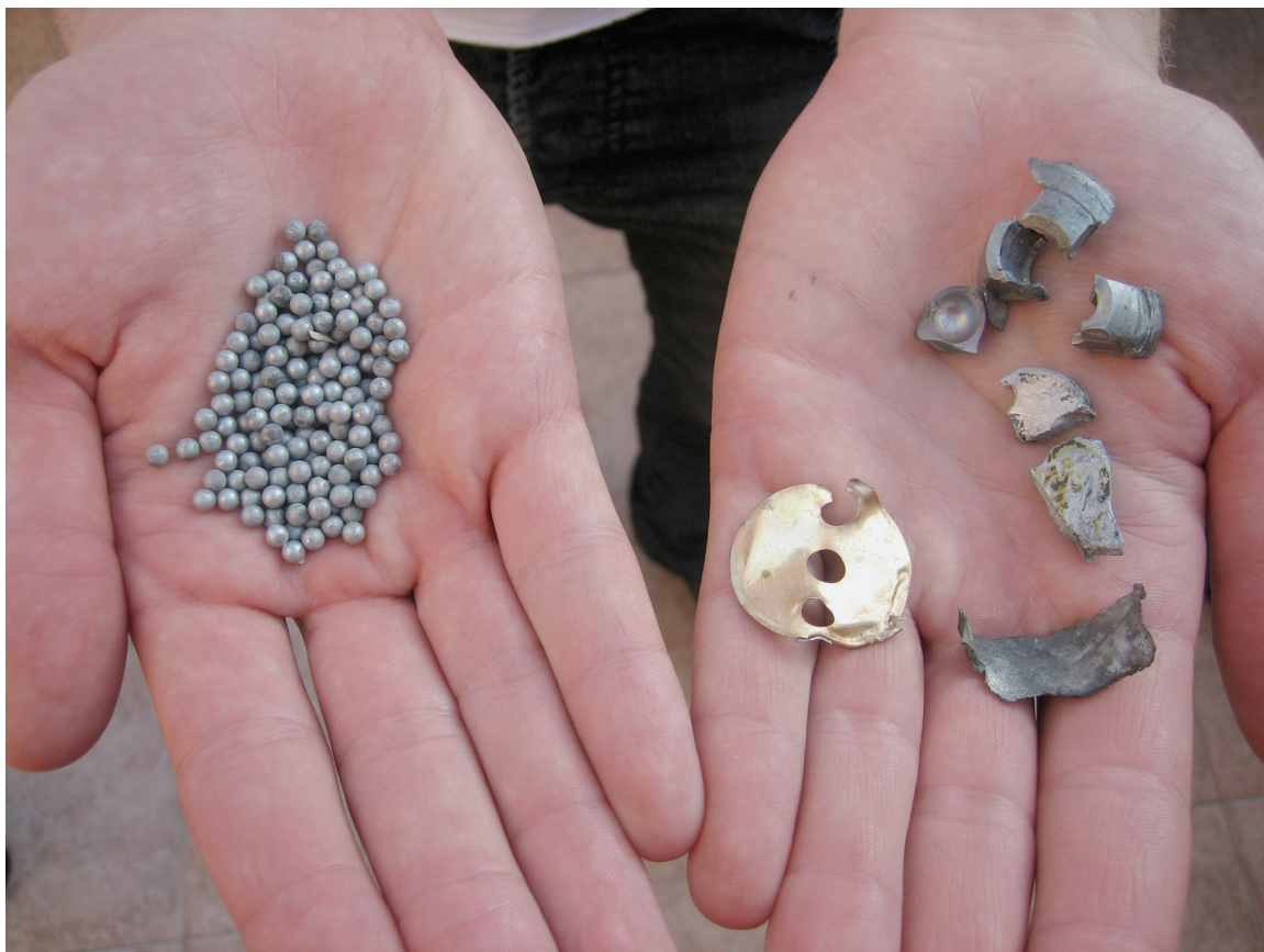
גבר אוזחז בפיסות תחמושת מצרר מסוג MZD-2 שלדבריו נחתו בחצרו שבכפר מר'אר ב-25 ביולי 2006. בצד שמאל ניתן לראות גולות פלדה בקוטר 3 מ"מ מסוגן של הגולות שפצעו שלושה מבני משפחתו. בצד ימין ניתן לראות חתיכות מחלקה העליון של תחמושת-משנה כזאת.

תחמושת המשנה מסוג MZD-2 קלה לזיהוי. פריטיה דומים בצורתם לפעמונים גליליים עם סרט באחד הקצוות. רצועת פלסטיק המלאה בגולות מתכת בקוטר 3 מ"מ כרוכה במאוזן סביב מרכז הגליל. בפנים ישנו "מטען חלול" חודר-שריון. גולות המתכת שהרקטות הרגילות של חיזבאללה בקוטר 122 מ"מ ובקוטר 220 מ"מ נושאות, כלומר הרקטות שאינן מכילות תחמושת-משנה, הן בקוטר של 6 מ"מ.