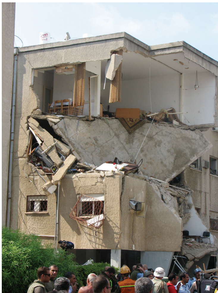
ב-17 ביולי 2006 פגעה רקטה בבית דירות זה, הנמצא בשכונת בת גלים בחיפה; שישה דיירים נפצעו.

מפקד משטרת חיפה גורס כי חיזבאללה כיוון את התקפותיו בעיקר אל מטרות באזור הנמל וכי הרקטות המעטות יחסית שנחתו בעיר העילית החטיאו את מטרותן. הבעיה היא שבין אזור הנמל והשכונות העשירות יותר בעיר העילית ישנן שכונות המגורים הנמוכות יותר, אשר חלקן מאוכלסות בצפיפות. לכן, אם אכן ניסה חיזבאללה לפגוע באובייקטים באזור החוף, הרי שלרקטות הבלתי-מדויקות שלו, שעפו מרחק של שלושים קילומטרים, היה סיכוי גבוה לפגוע בשכונות מגורים ובאזורי מסחר סמוכים, ואמנם כך היה.