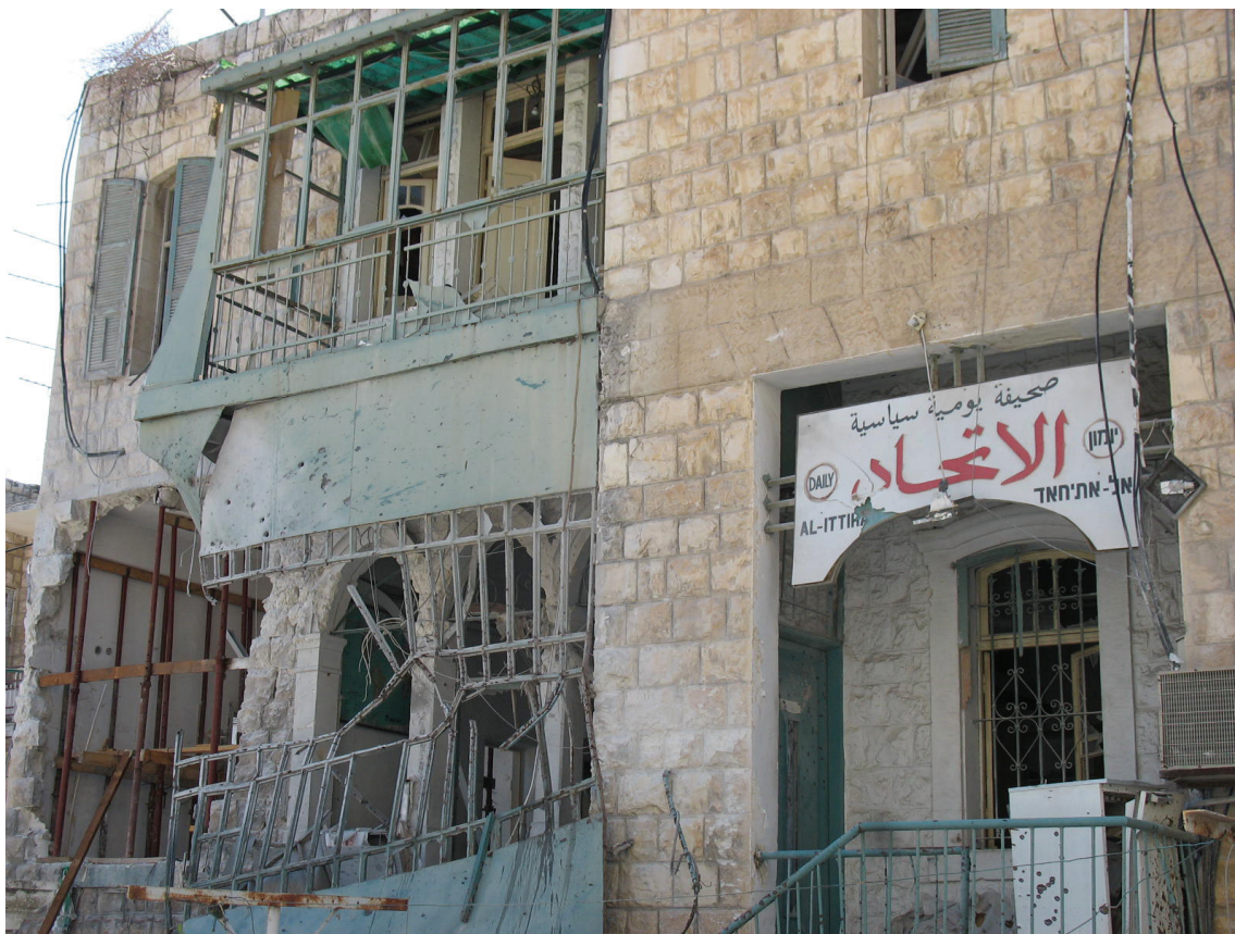
בניין שבו נמצא ארכיון העיתון אל-איתחאד בשכונת ואדי ניסנאס בחיפה לאחר פגיעת רקטה ב-6 באוגוסט 2006; מפגיעת הרקטה נהרגו שני קשישים בבניין הסמוך.

גם אם אכן כיוון חיזבאללה, במשך חלק מן הזמן, את התקפותיו על אובייקטים צבאיים או על מתקני תעשייה בחיפה, הרי שהארגון לא הביע כל צער על כך שאזרחים נהרגו כתוצאה מהתקפותיו. זאת, עד ה-6 באוגוסט, אז פגעו הרקטות שלו בשכונת ואדי ניסנאס המאוכלסת ברובה בערבים. בהתקפה נהרגו שני תושבים ותושב שלישי נפצע קשה. רק אז עלה מזכ"ל חיזבאללה חסן נסראללה לשידור בטלויזיה והפציר בתושבים ערבים לעזוב את העיר (ראו להלן פרק אודות "הצדקות חיזבאללה להתקפות על אזורים אזרחיים").