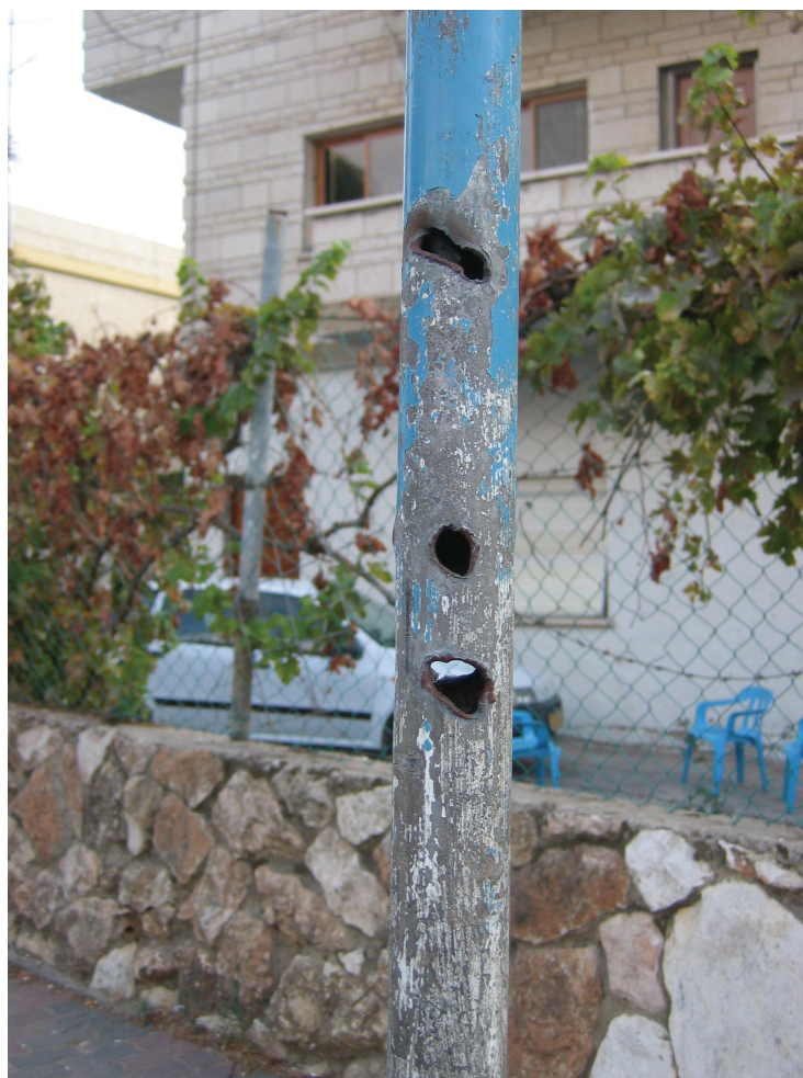
עמוד במג'ד אל-כרום שחדרו אליו גולות פלדה ורסיסים מרקטה שפגעה ברחוב בקרבת מקום ב-4 באוגוסט 2006; מפגיעת הרקטה נהרגו שני גברים.

כשנשאל על מטרות צבאיות אפשריות ציין אסדי פתחי כי ישראל הציבה תותח ארטילריה על פסגת הר חלוץ, כשני קילומטרים מצפון-מזרח לדיר אל-אסד, וכי מסוללה זו בוצע במהלך המלחמה ירי בלתי פוסק לשטח לבנון. הוא שיער כי ייתכן שהרקטות שנחתו על בית משפחתו החטיאו את תותח הארטילריה, שהיה יעדן המקורי. לדבריו, "אנחנו פשוט אזרחים במדינת ישראל. מה שקורה לאחרים קורה גם לנו". 154