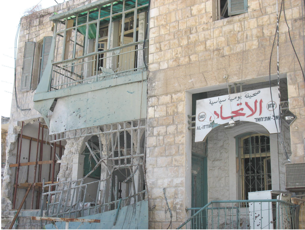
مبنى في حي وادي نسناس في حيفا، فيه أرشيف صحيفة الاتحاد، بعد أن ضرب صاروخ المبنى في 6 أغسطس/أب 2006، ليتسبب في مقتل شخصين مسنين في المبنى المجاور.

إذا كان حزب الله يستهدف حقاً أهدافاً عسكرية أو صناعية في حيفا في بعض الأوقات، فهو لم يبد أسفه على الإصابات التي لحقت بالمدنيين حتى أصاب أحد صواريخه لأول مرة حي وادي النسناس الذي تسكنه أغلبية من العرب، في 6 أغسطس/أب والذي تسبب في مقتل اثنين من السكان وألحق إصابات خطيرة بثالث. حينها ظهر أمين عام حزب الله نصر الله على التلفزيون ليناشد السكان العرب على مغادرة المدينة (انظر فصل "مبررات حزب الله للهجمات على المناطق المدنية" أدناه).