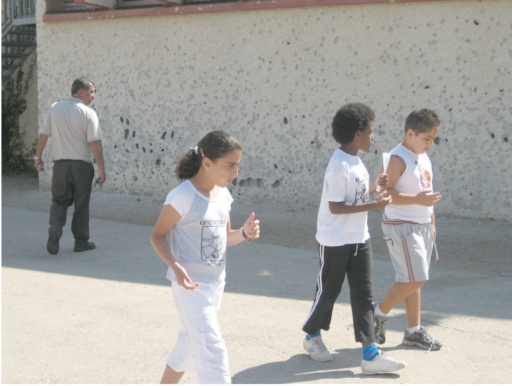
جدار مدرسة "هاميفلاشيم" الابتدائية في كريات يام، والتي تضررت من الكريات المعدنية المنبعثة من صاروخ أصاب قاعة درس مجاورة في 13 أغسطس/أب 2006.

ولم يقدم حزب الله معلومات محددة عن هجماته على كريات يام أو أهدافه المقصودة بها، ولم يرد على رسالة هيومن رايتس ووتش إليه التي تطالب فيها بمعلومات عن هذه الهجمات.