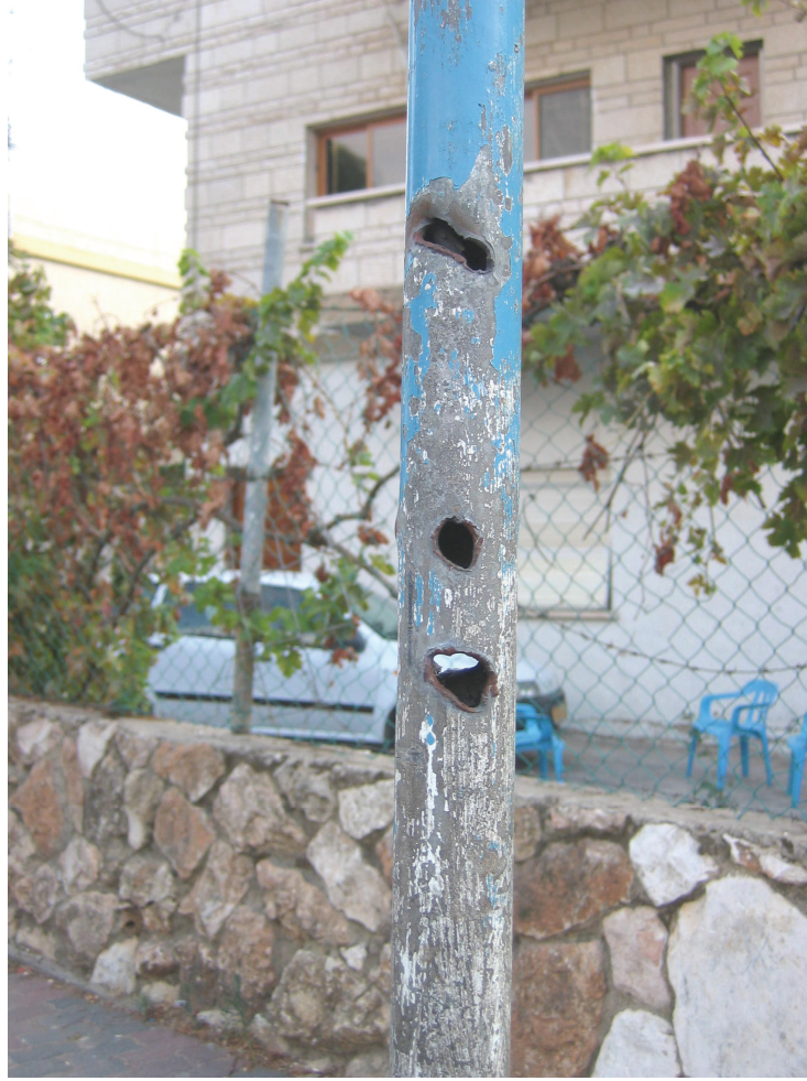
عمود على الطريق في ميدال كروم اخترقته كريات معدنية وشظايا من صاروخ سقط في الشارع على مقربة من العمود في 4 أغسطس/أب 2006، ليتسبب في مقتل رجلين.

وبزيارة موقع الهجوم في 30 سبتمبر/أيلول، رأت هيومن رايتس ووتش حفرة مغطاة في الشارع وهي التي قال حسين إن الصاروخ تسبب فيها، وكذلك ضرراً لحق بلافتات وأعمدة الشارع القريبة جراء الشظايا.