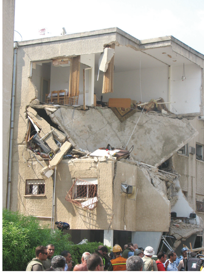
أصاب صاروخ هذه الشقة السكنية في حي بيت جاليم بحيفا في 17 يوليو/تموز 2006، ليتسبب في إصابة ستة من السكان.

منطقة بنايات سكنية قليلة الطوابق، والقاعدة البحرية، ومستشفى رامبام؛ والثانية في منطقة الميناء المركزية (وتتضمن ضربة ورشة السكة الحديد يوم 16 يوليو/تموز) والأحياء الواقعة أعلاها؛ والثالثة تتضمن خزانات المواد الكيماوية والوقود ومعامل التكرير إلى شرق الميناء. وأكدت مقابلات مع سكان المدينة اليهود والعرب هذا النسق المذكور.