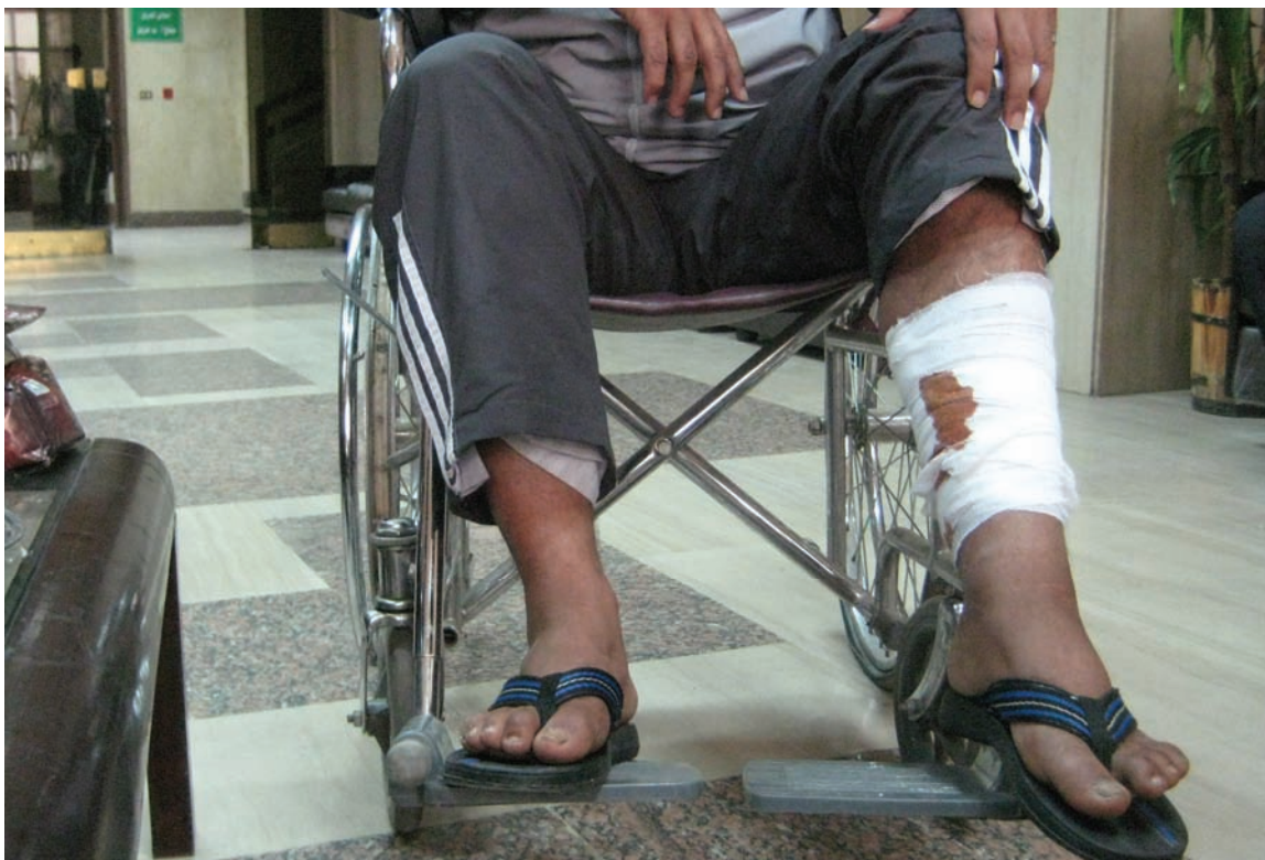
ב-1 בינואר 2009 נורה אדם זה ברגלו בעיר עזה לאחר שקידם בברכה את המתקפה הישראלית וחילק סוכריות לרגל המאורע. על-פי הטענה, היורים השתייכו לחמאס.

חילקתי סוכריות". 13 לדבריו, ב-1 בינואר, כשחזר הביתה מביקור אצל חבר בעיר עזה, ראה שני צעירים שלא הכיר חמושים ברובי קלאצ'ניקוב (AK-47). השניים כיוונו את רוביהם אל רגליו ואחד מהם פתח באש. לדברי האיש, הוא נלקח באמבולנס לבית החולים א-שיפאא, שם חלק חדר עם שני אנשים אחרים, שאת שמותיהם לא הכיר, ואשר אמרו כי כוחות חמאס ירו גם ברגליהם.