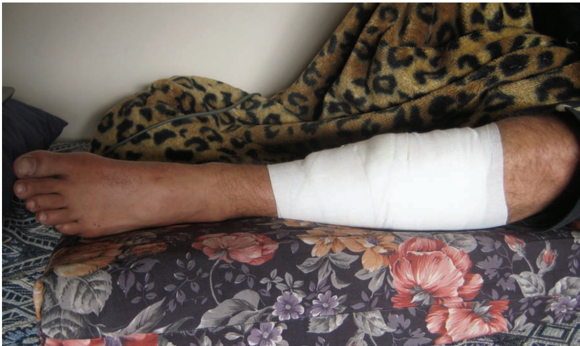
אדם זה, שהיה בעבר חבר במנגנון הביטחון המסכל שהופעל בידי פתח, נלקח בסוף חודש ינואר 2009 מביתו בעיר עזה בידי ארבעה חמושים רעולי פנים, ונורה פעמיים ברגלו.

לדבריו, האנשים הסירו את הכיסוי מפניו והתירו לו להתפלל את תפילת הערב, ולאחר מכן כיסו שוב את פניו והסיעו אותו למקום אחר, שבו כפו עליו לשבת על הקרקע ברגליים ישרות. לדברי הקורבן, "ברגע שעשיתי את זה, שניים מהם ירו בי ברגל שמאל". אנשי ארגון Human Rights Watch חזו ברגלו השמאלית החבושה.