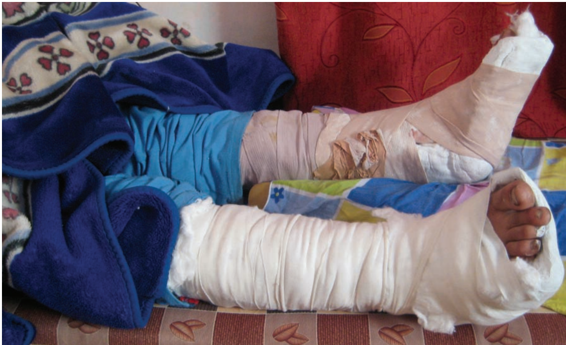
איש זה אמר כי "עשה טעות" כשמתח ביקורת על חמאס ברחוב בעיר עזה באמצע חודש ינואר 2009. מאוחר יותר באותו יום לקחו אותו מביתו חמושים רעולי פנים וירו ברגליו.

האיש אמר לארגון Human Rights Watch, "בערך ארבעה-עשר מהם הגיעו לקחת אותי. הם הכריחו אותי ללכת מהבית שלי למקום חשוך ליד מסגד, וארבע מהם ירו בי ברגליים, ירייה אחת כל אחד, אבל אחד מהם פספס. חמאס משלם לאנשים להקשיב בשבילו – אנחנו קוראים להם 'מל"טים' 12 – והמל"טים שמעו אותי. האיש הוסיף כי אינו פעיל פוליטי ואינו חבר בפתח. חוקרי Human Rights Watch חזו בתחבושות שעל רגליו.