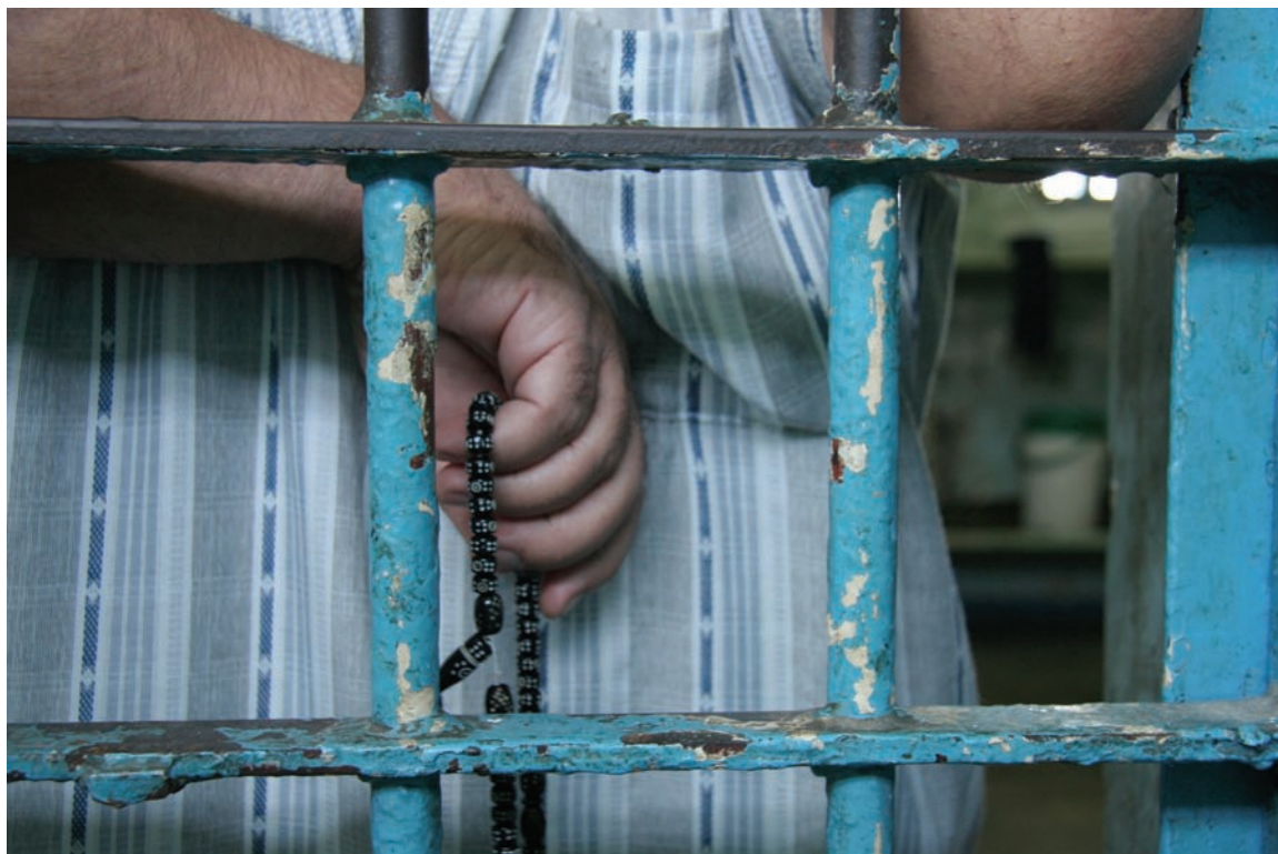
אדם שהוחזק בכלא המרכזי של עזה בחודש אוקטובר 2007.

למחרת כשישראל הפציעה את הכלא, אך אותרו בסופו של דבר ונהרגו בידי חמושים רעולי פנים. הנציבות העצמאית לזכויות האדם (ICHR) תיעדה 20 מקרים של אסירים נמלטים שנורו ונהרגו בידי חמושים רעולי פנים החל ב-28 בדצמבר ועד ה-31 בינואר; לפחות 123 מהקורבנות הוחזקו בכלא במעצר בעילה של "שיתוף פעולה עם האויב". 15 על-פי המרכז הפלשתיני לזכויות האדם (PCHR), ארגון עצמאי לזכויות האדם, 17 מ-29 הקורבנות שנהרגו בידי חמושים בין ה-2 בדצמבר ל-27 בפברואר היו אסירים ועצירים שנמלטו ממתחם הכלא לאחר שישראל תקפה אותו, ובהם 13 אנשים שנידונו למוות בעוון שיתוף פעולה עם ישראל, שלושה שהורשעו בביצוע עבירות פליליות ואדם אחד שהמתין למשפטו. 16