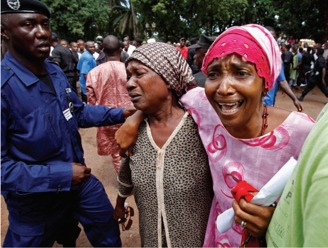
À la grande mosquée de Conakry, réaction de deux femmes à la recherche des corps de parents et d'amis qui ont été tués lors d'un rassemblement organisé le 28 septembre 2009.

Les pressions pour qu'une enquête sur les violences soit ouverte se sont probablement fait d'autant plus sentir que le 14 octobre 2009, le procureur de la Cour pénale internationale, Luis Moreno-Ocampo, a confirmé que la situation en Guinée faisait l'objet d'un examen préliminaire effectué par son Bureau. 40 En février 2010, Béatrice le Fraper du Hellen, alors chef de la Division de la compétence, de la complémentarité et de la coopération au Bureau du Procureur, a déclaré : « Il n'y a pas d'alternative : soit il [le gouvernement] engage des poursuites, soit nous le ferons. » 41