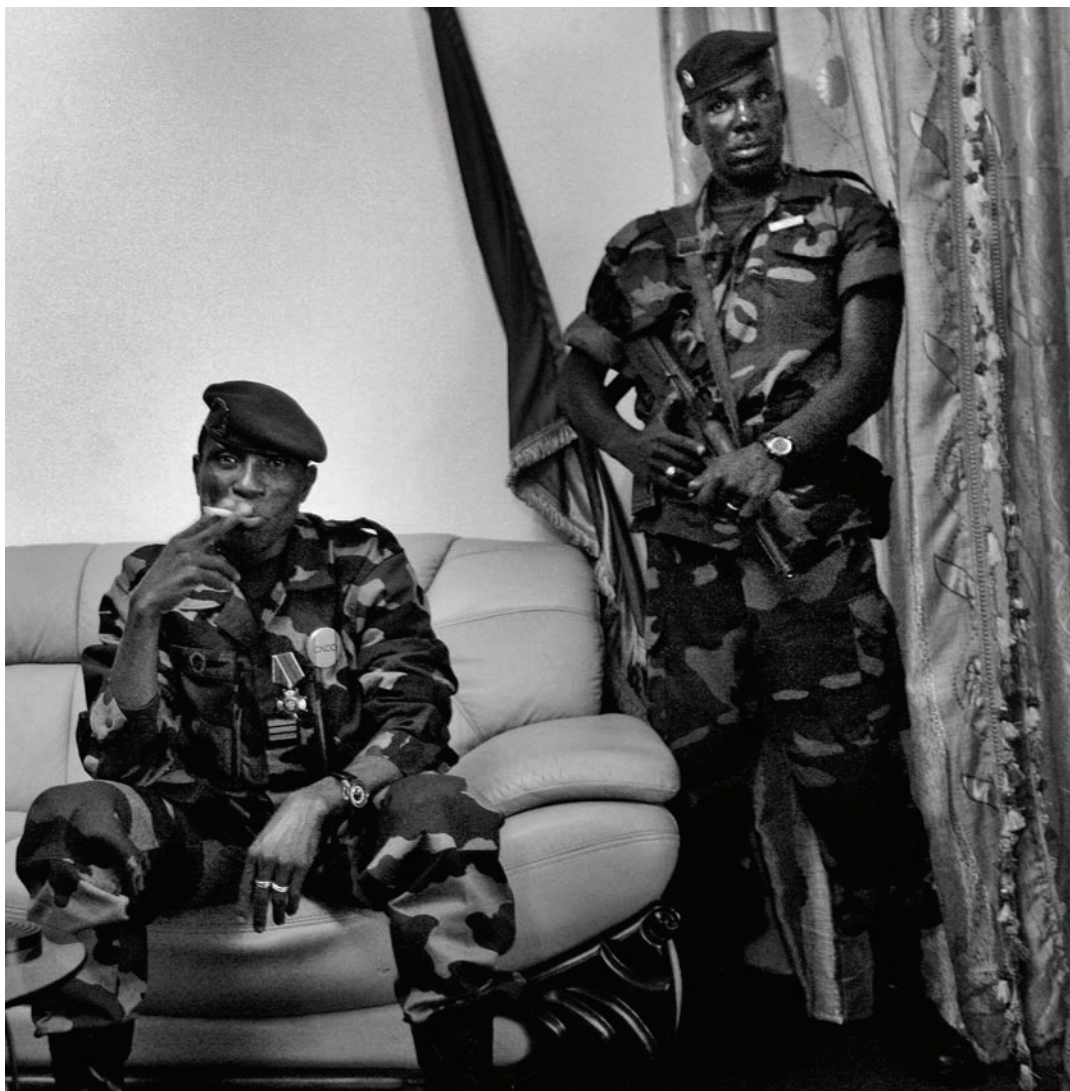
Le coup d'État perpétré sans effusion de sang sous la direction du Capitaine et président autoproclamé Moussa Dadis Camara dans les heures qui ont suivi le décès du Président Conté, le 22 décembre 2008, a suscité l'espoir d'une amélioration sur le plan des problèmes persistants de droits humains de la Guinée. Toutefois, son unique année au pouvoir a été marquée par de graves exactions, notamment le massacre sanglant de quelque 150 partisans de l'opposition en septembre 2009.

Pendant toute l'année où le CNDD a occupé le pouvoir, des groupes de soldats lourdement armés se sont livrés à des actes généralisés de vol, d'extorsion et de violence, entre autres des attaques et braquages de magasins, d'entrepôts, de centres médicaux et d'habitations en plein jour et la nuit. Dadis, nom sous lequel il est généralement connu, a gouverné par décret, sapant et mettant à l'écart le système judiciaire guinéen. Le CNDD a forcé d'anciens ministres du gouvernement et d'autres personnes, accusés d'avoir détourné des fonds publics ou de