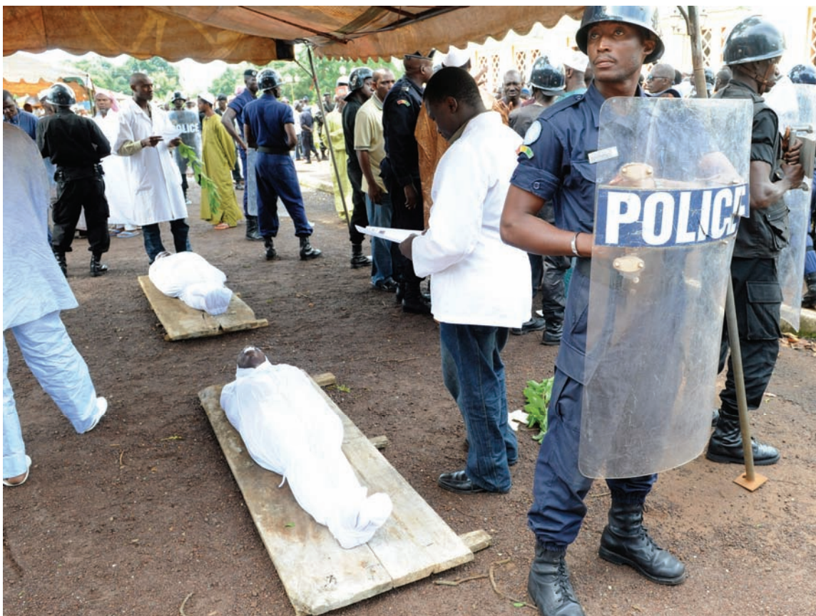
Un policier se tient près des corps de personnes abattues par les forces de la junte guinéenne le 28 septembre 2009 devant la grande mosquée de Conakry.

Néanmoins, les responsables du Bureau du Procureur de la CPI qui se sont rendus en Guinée en février, mai et novembre 2010, ainsi qu'en mars 2011, pour évaluer les progrès opérés dans les enquêtes nationales, ont salué à la fois les capacités techniques des juges d'instruction, ainsi que l'indépendance dont ils font preuve en se soustrayant à toute ingérence gouvernementale. En mai 2010, les responsables de la CPI ont rapporté que les juges d'instruction avaient déjà interrogé 200 personnes et étaient satisfaits des progrès enregistrés dans l'enquête. 43 Des sources guinéennes interrogées en juin 2010 ont signalé à Human Rights Watch qu'à ce moment, deux individus avaient été arrêtés pour leur implication présumée dans les crimes commis en septembre 2009. 44 Depuis lors, une troisième personne a été inculpée de crimes en lien avec les meurtres et viols de septembre