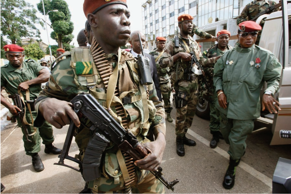
Le Capitaine Moussa Dadis Camara, alors chef de la junte au pouvoir, arrive pour les célébrations du 2 octobre 2009 commémorant l'indépendance de la République de Guinée.

Certains membres de l'appareil judiciaire guinéen et de l'Ordre des Avocats de Guinée ont déclaré à Human Rights Watch qu'ils croyaient à la fois à la volonté politique et aux capacités techniques du système judiciaire guinéen de rendre justice pour les crimes commis en septembre 2009. Comme l'a fait remarquer un haut responsable judiciaire guinéen au courant de l'enquête : « Nous sommes capables de faire en sorte que justice soit rendue dans cette affaire. Soyez assurés que nous remuerons ciel et terre dans cette enquête ; nous considérons tout le monde—proche ou éloigné. » 50