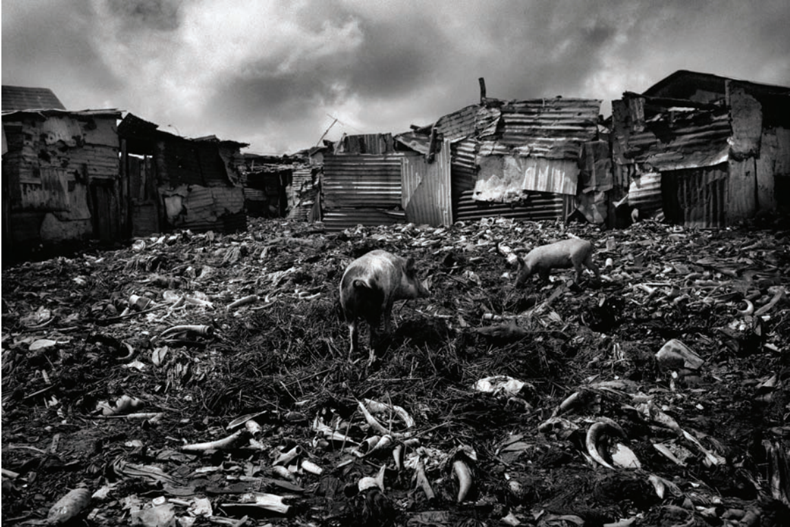
Des cochons cherchent de la nourriture dans des immondices derrière un abattoir. En dépit de ses abondantes ressources naturelles, la Guinée se classe parmi les pays les plus pauvres du monde dans l'Indice de développement humain des Nations Unies.

Des responsables du Ministère des Finances, des diplomates étrangers, des hommes d'affaires et des citoyens guinéens ordinaires qui se sont entretenus avec Human Rights Watch ont décrit des niveaux de corruption extrêmement élevés tant au sein du secteur public que du secteur privé. Des Guinéens et des Guinéennes ont confié qu'ils devaient soudoyer les fonctionnaires pour obtenir des certificats de naissance, des titres de propriété, des permis de conduire et des permis de bâtir. Ils doivent également payer s'ils veulent obtenir une place pour leurs enfants à l'école publique, être soignés dans un dispensaire public, obtenir un emploi ou déposer plainte à la police.