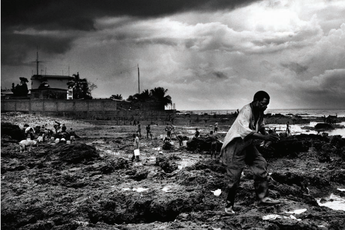
Des cochons cherchent de la nourriture dans des immondices derrière un abattoir tandis que des hommes se lavent dans la mer. En 2010, la Guinée était classée 156e sur les 169 pays repris dans l'Indice de développement humain des Nations Unies. Conakry, Guinée.

Fin 2008, le Fonds monétaire international a reconnu certains progrès enregistrés sur le plan du renforcement de la gouvernance économique, notamment la publication des comptes audités de la banque centrale, mais il demeure préoccupé par les procédures appliquées dans la passation des grands marchés publics. 183 Les efforts visant à réviser le Code des marchés publics qui présente de « profondes imperfections » n'ont abouti à rien. 184 En 2005, le gouvernement a créé un Comité de pilotage pour l'ITIE, mais ici aussi, des progrès insuffisants ont été enregistrés pour faire partie des pays se conformant aux principes de l'ITIE. 185