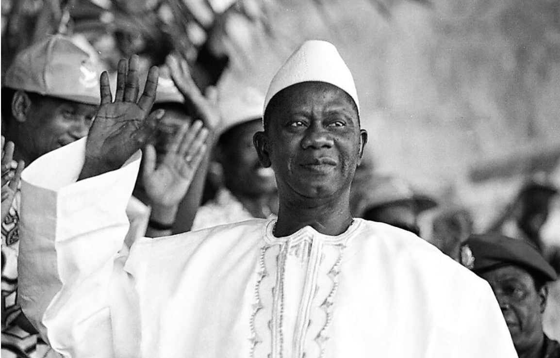
Le Colonel Lansana Conté s'est emparé du pouvoir lors d'un coup d'État perpétré en 1984. En dépit de promesses initiales garantissant un meilleur respect des droits humains, le Président Conté a régné sur le pays pendant un autre quart de siècle (1984-2008) marqué par une répression et des exactions cautionnées par l'État, bien que beaucoup moins extrêmes que celles commises sous son prédécesseur.

Face à des niveaux croissants de corruption et de pauvreté et à une multiplication des abus du gouvernement, diverses associations professionnelles et de la société civile ont, à plusieurs reprises, organisé des manifestations à travers le pays, dont beaucoup ont été réprimées violemment par les forces de sécurité de Conté. En juin 2006, les forces de sécurité ont abattu au moins 13 protestataires à Conakry. 17 En janvier et février 2007, les forces de sécurité, notamment la garde présidentielle, ont fait feu directement sur les foules de manifestants non armés qui participaient à une grève nationale pour protester contre la détérioration des conditions économiques et la mauvaise gouvernance, débouchant sur un bilan d'au moins 137 morts et plus de 1 700 blessés. 18