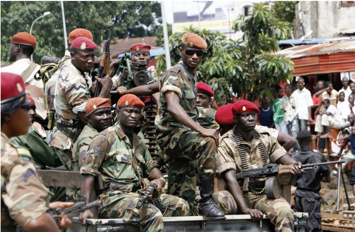
Des soldats patrouillent à bord d'un véhicule près de l'aéroport international de Conakry, le 5 octobre 2009.

résoudre ces problèmes. Cette initiative vise principalement à soumettre les services de sécurité au contrôle civil, à réduire le nombre démesuré d'effectifs militaires et à garantir la transparence financière. Les résultats des travaux du groupe ont été présentés dans un rapport au gouvernement de transition guinéen en mai 2010. Les plus de 150 recommandations légitimes du rapport visant à professionnaliser le secteur sont destinées à servir de feuille de route opérationnelle pour la réforme.