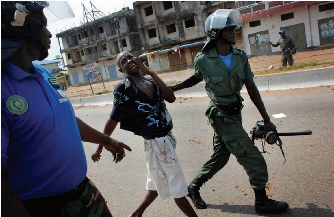
Le lundi 15 novembre 2010, à Conakry, la police guinéenne arrête un partisan du candidat de l'UFDG à la présidentielle, Cellou Dalein Diallo, lors de violents incidents liés aux élections.

Human Rights Watch recommande vivement au nouveau gouvernement de garantir l'indépendance de la commission à l'égard de la présidence en rendant ladite commission opérationnelle, entre autres en ce qui concerne les nominations et le financement, conformément aux Principes de Paris et aux meilleures pratiques des commissions des droits humains. La création d'un organe fort, indépendant, impartial et suffisamment financé peut jouer un rôle significatif en contribuant à développer la culture du respect des droits humains et l'État de droit en Guinée.