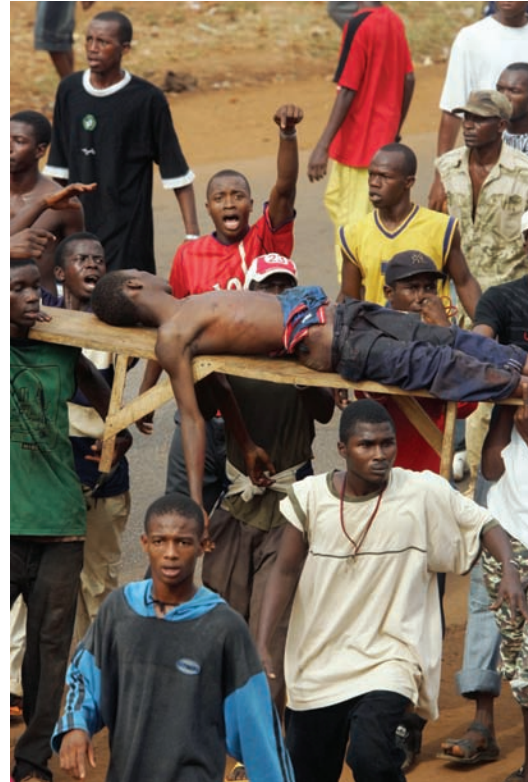
Des protestataires portent le corps d'un manifestant tué par les forces de sécurité, le 22 janvier 2007, lors d'une manifestation au cours de laquelle des dizaines de milliers de Guinéens ont tenté de marcher en direction du bâtiment de l'Assemblée nationale dans la capitale, Conakry. L'homme apparaissant sur la photo est l'une des 129 victimes au moins qui ont été tuées par les forces de sécurité au cours des violences survenues lors de la grève de janvier et février 2007.

La commission nationale d'enquête sur les violences liées à la grève de 2007 a été établie par l'Assemblée nationale en mai 2007, et les 19 membres qui la composent ont prêté serment. Néanmoins, selon le président très respecté de la commission, Mounir Hussein, le gouvernement guinéen ne lui a fourni ni financement, ni soutien logistique. 65 Le mandat de la commission a expiré en janvier 2009. Elle n'a mené aucune enquête.