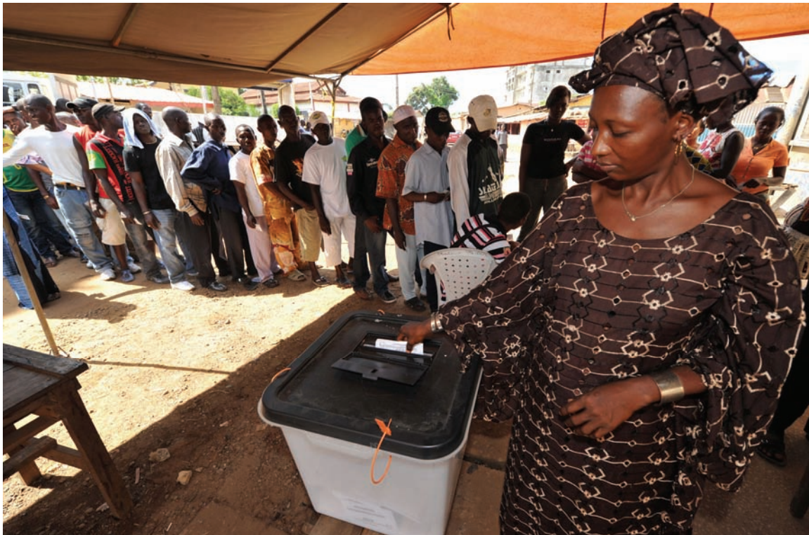
Femme votant dans un bureau de vote de Conakry le 7 novembre 2010.

La corruption tant dans le secteur public que privé est endémique en Guinée. Qu'il s'agisse d'actes de corruption à petite échelle et de demandes de pots-de vin auxquels se livrent des fonctionnaires de première ligne, ou d'extorsion, de détournement de fonds et de négociations de contrats illicites qui se trament dans l'ombre, les personnes impliquées dans des pots-de-vin et autres formes de corruption font rarement l'objet d'enquêtes, et sont encore moins souvent traduites en justice. Les anciens dirigeants guinéens ont aussi en grande partie mal géré, détourné et dilapidé les revenus émanant des abondantes ressources naturelles du pays, privant ainsi la majorité de la population d'un accès aux soins de santé et au niveau d'éducation les plus élémentaires. Par voie de conséquence, la Guinée est l'un des pays les plus pauvres du monde et enregistre des taux d'analphabétisme adulte et de mortalité infantile et maternelle parmi les plus élevés au monde, en dépit de ses ressources naturelles.