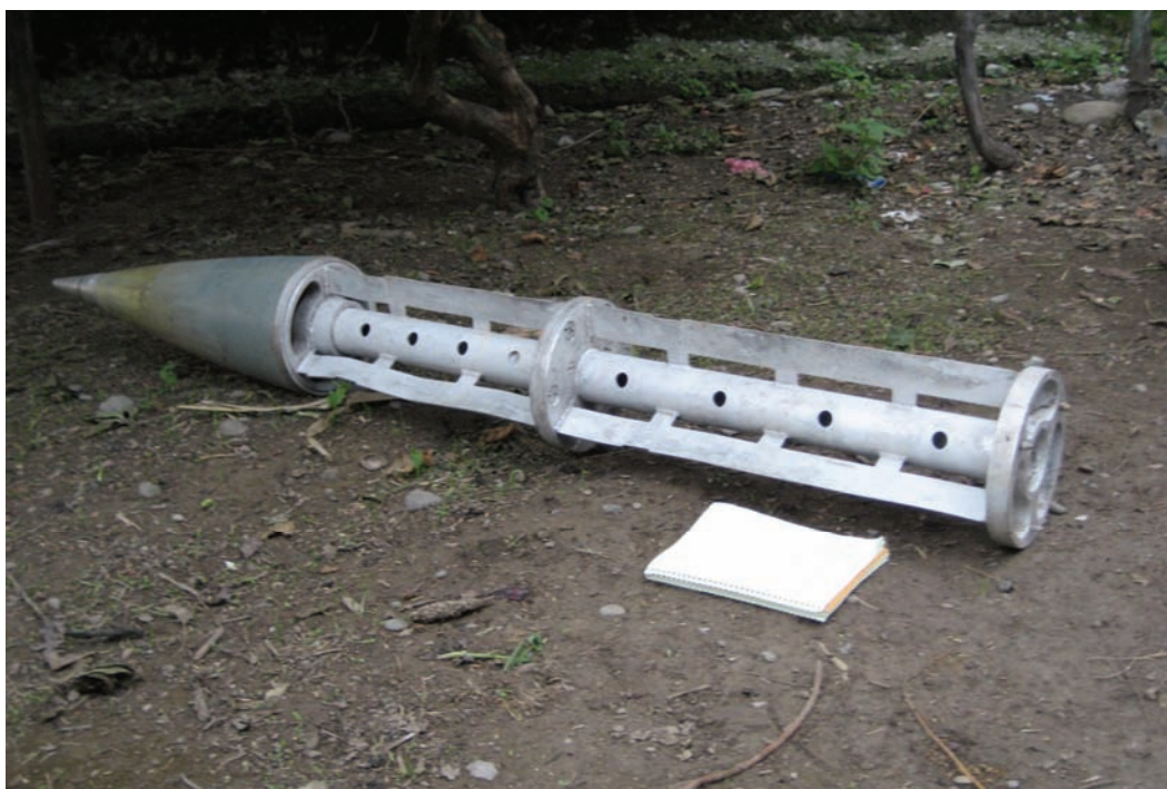
Фрагмент реактивного снаряда РСЗО «Ураган», найденный после удара по селу Руиси 12 августа 2008 г. Фотография сделана 15 октября 2008 г.