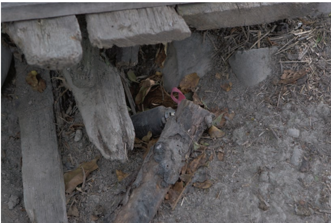
Неразорвавшийся суббоеприпас М-85 у одного из домов в селе Шиндиси в августе 2008 г.