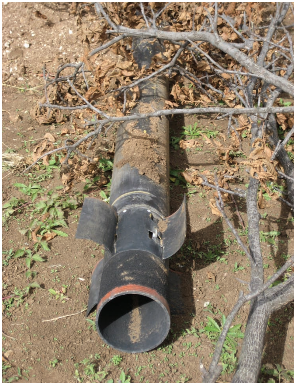
Фрагмент реактивного снаряда МК-4 на поле у села Дици. Фотография сделана 17 октября 2008 г.