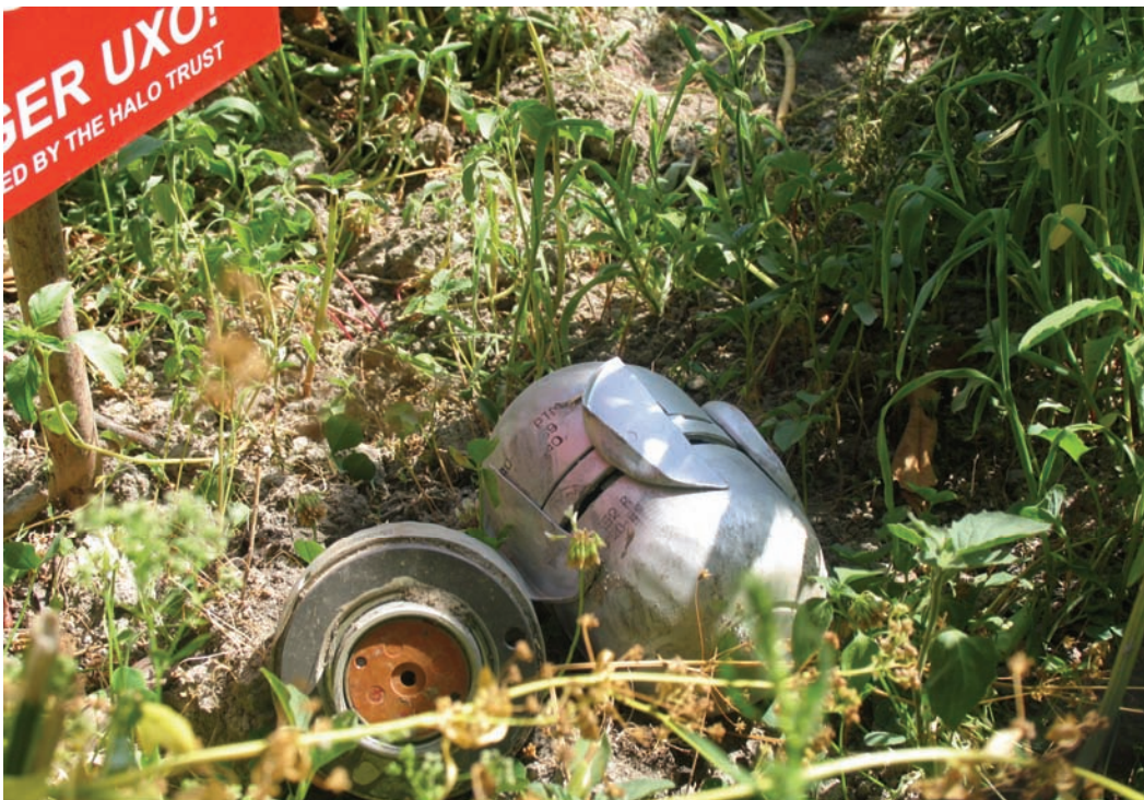
Неразорвавшийся российский суббоеприпас АО-2,5 PTM недалеко от центральной площади села Вариани в августе 2008 г.