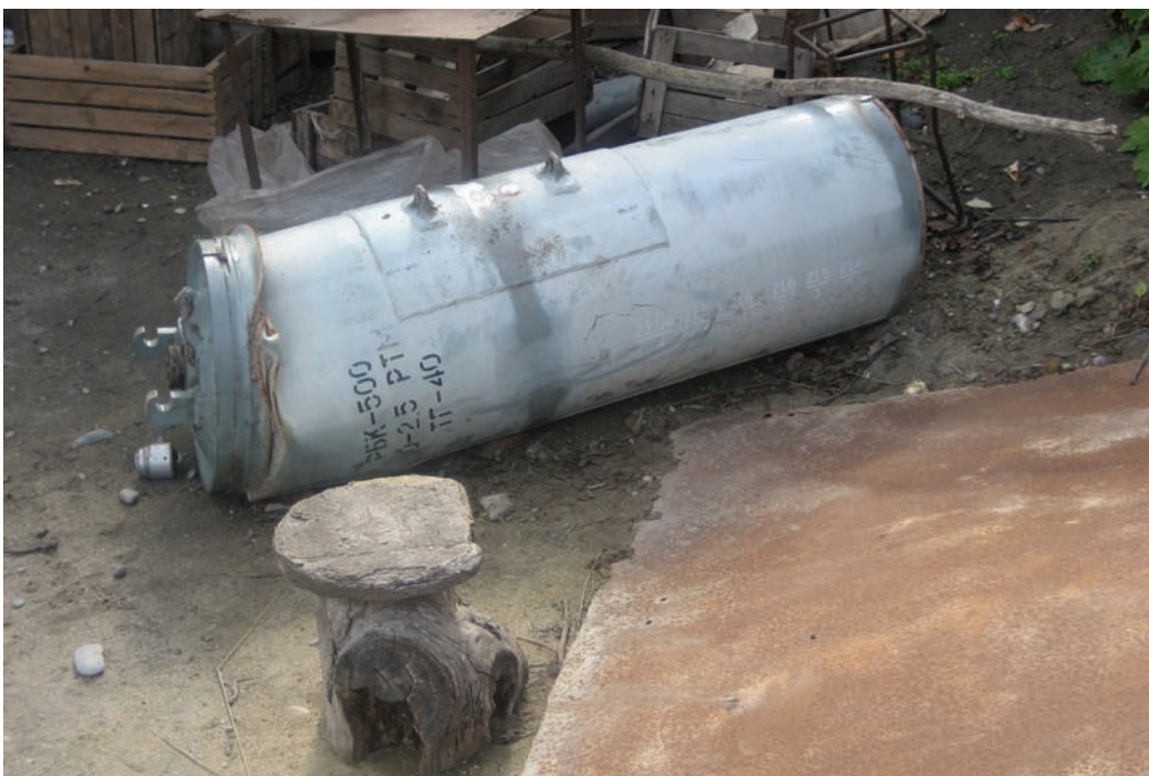
Российская кассета РБУ-500, найденная недалеко от центральной площади в селе Вариани. Фотография сделана 18 октября 2008 г.