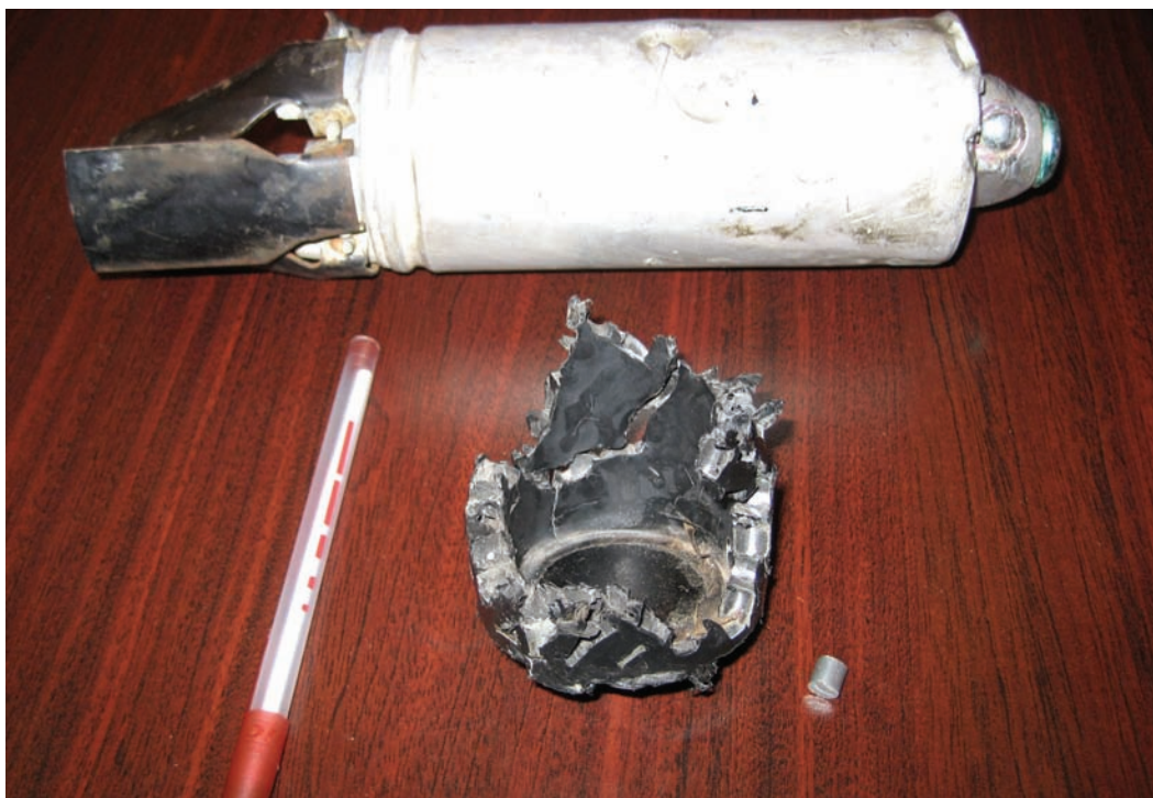
Российский суббоеприпас 9H210 и его поражающий элемент в офисе организации по разминированию.