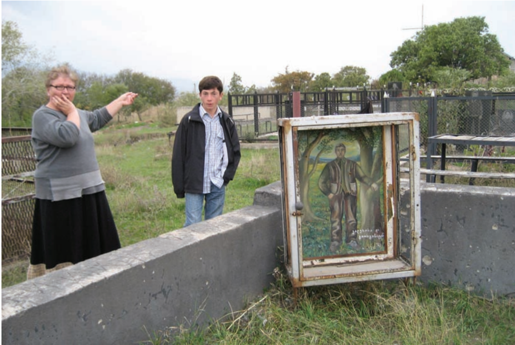
Одна из пострадавших в результате российского удара по селу Руиси 12 августа 2008 г. показывает место у церкви, где она и еще несколько женщин пытались укрыться. Подошедший мальчик рассказал о находке неподалеку неразорвавшегося суббоеприпаса. Фотография сделана 15 октября 2008 г.