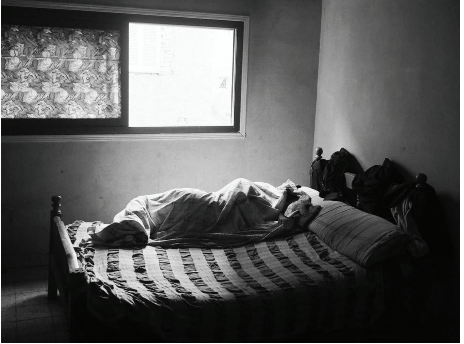
ضحية إيتار إيريتري نائم في منزل آمن في القاهرة، بمصر، يوم ٢ مايو/أيار ٢٠١٣. يتمكن بعض ضحايا الإيتار الذين يفرون من أسرهم أو يفرجون عنهم في سيناء، من بلوغ قيادات مجتمعية بدوية، تساعد في سفرهم إلى القاهرة حيث تساعد عدّة منظمات مجتمع مدني.

بناء على مقابلات هيو من رابيتس ووتش وبحسب تقديرات الأمم المتحدة، فإن السلطات لا تفرج عنهم إلا بعد شراء المحتجزين تذكرة طيران إلى أثيوبيا، بموجب ترتيب قائم بين مصر وأثيوبيا، يسمح للإريتريين بالسفر جواً من القاهرة إلى أديس أبابا العاصمة الأثيوبية. وكأنما تقوم السلطات المصرية باحتجاز ضحايا الإيتار رهائن للمرة الثانية، فتعرضهم للاحتجاز دون أجل مسمى بشكل تعسفي في أوضاع صعبة، ترقى في بعض الأحيان إلى المعاملة اللاإنسانية والمهينة، إلى أن يتمكن أقاربهم من جمع النقود اللازمة لشراء تذكرة الطيران، للإفراج عنهم وإخراجهم من البلاد.