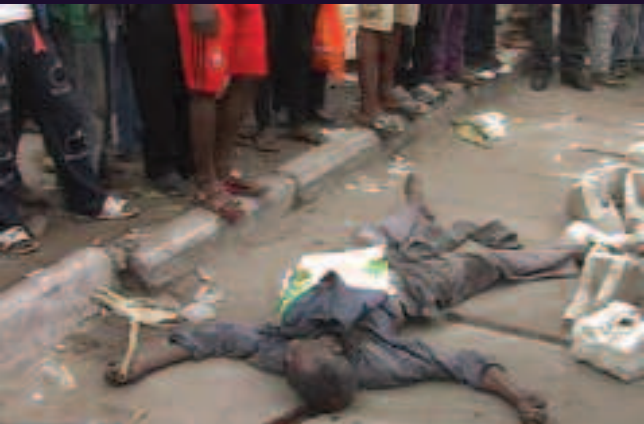
Commune de Masina, Kinshasa. 27 novembre 2013.