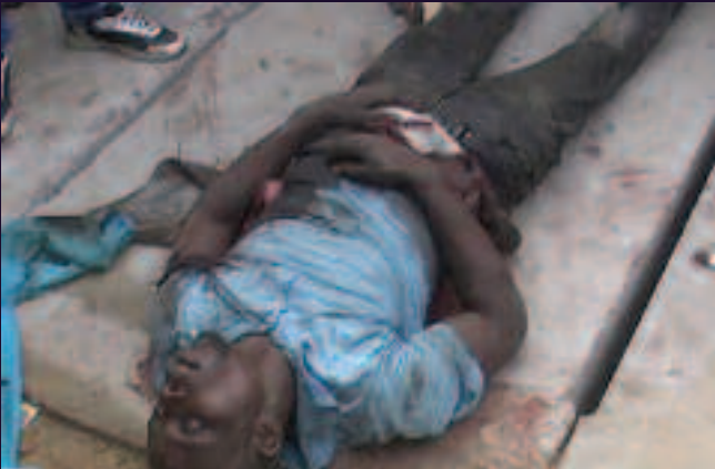
Commune de Kalamu, Kinshasa. 21 novembre 2013.