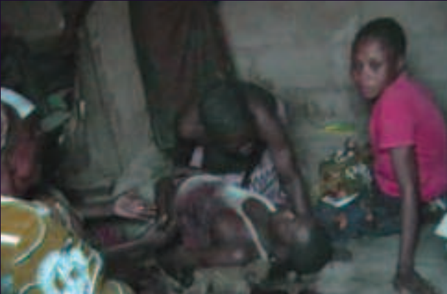
Commune de Masina, Kinshasa. 20 novembre 2013.