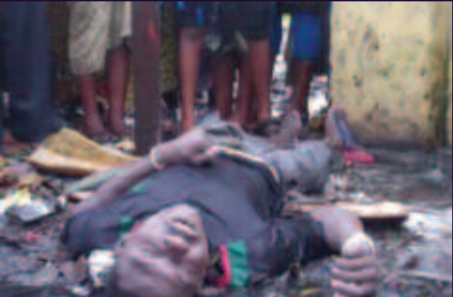
Commune de Limete, Kinshasa. 26 novembre 2013.