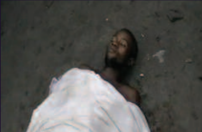
Commune de Bumbu, Kinshasa. 18 novembre 2013.