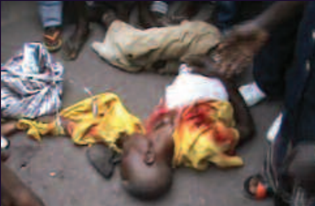
Commune de Masina, Kinshasa. 21 novembre 2013.