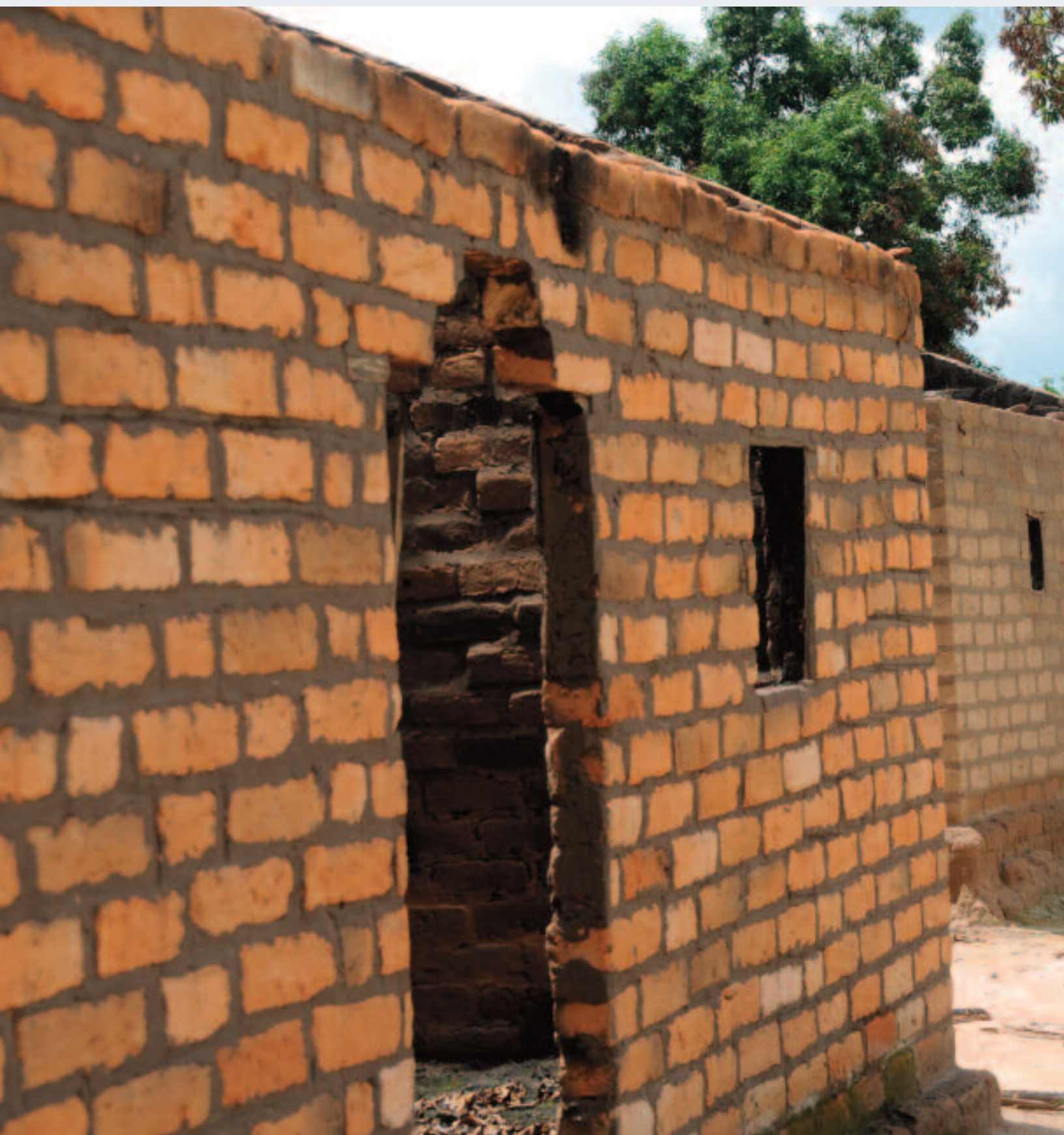
Des maisons détruites dans le village de Ndanika, attaqué par la Séléka les 14 et 15 avril 2013.