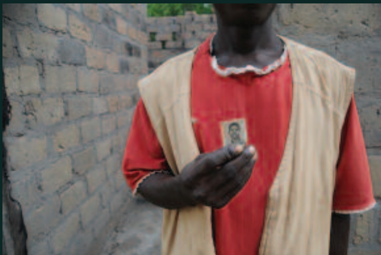
Un habitant du village de Ndanika, en République centrafricaine, tient une photo de son père, mort dans la brousse après avoir fui la Séléka le 14 avril 2013.

Human Rights Watch appelle le gouvernement de transition à prendre de toute urgence des mesures pour s'assurer que les personnes responsables d'exécutions illégales de civils soient traduites en justice, et pour empêcher que de nouvelles exécutions soient perpétrées par les membres de la Séléka. Les dirigeants de la Séléka devraient agir immédiatement pour empêcher leurs hommes de s'en prendre aux civils et de détruire leurs maisons. Les acteurs internationaux devraient prendre des mesures, notamment en envisageant des sanctions, afin de faire pression sur la Séléka pour qu'elle exige de ses membres qu'ils rendent compte de leurs actes et pour veiller à ce que le gouvernement de transition s'emploie à empêcher de nouvelles exactions. Tout l'appui nécessaire devrait être apporté à la Mission internationale de soutien à la Centrafrique sous conduite africaine, la force de maintien de la paix qui a pour mandat la protection des civils dans le pays.