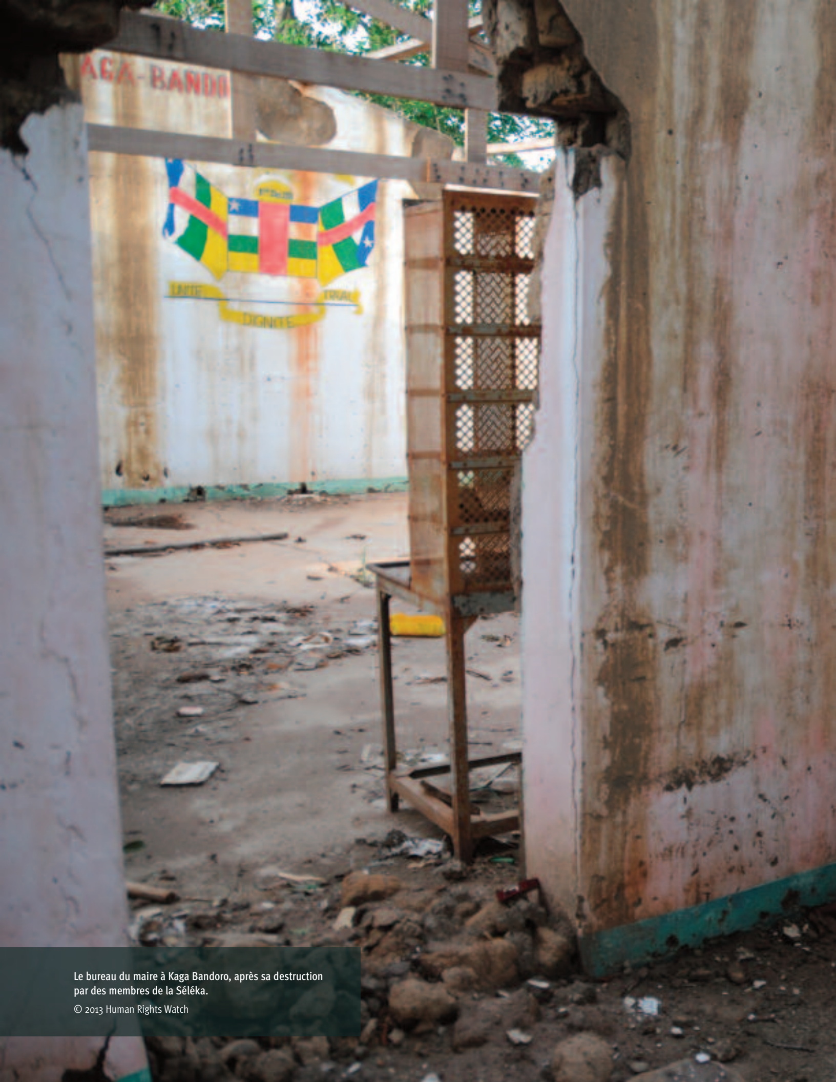
Le bureau du maire à Kaga Bando, après sa destruction par des membres de la Séléka.