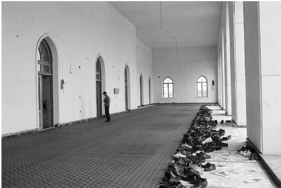
Официальная мечеть в Ташкенте.