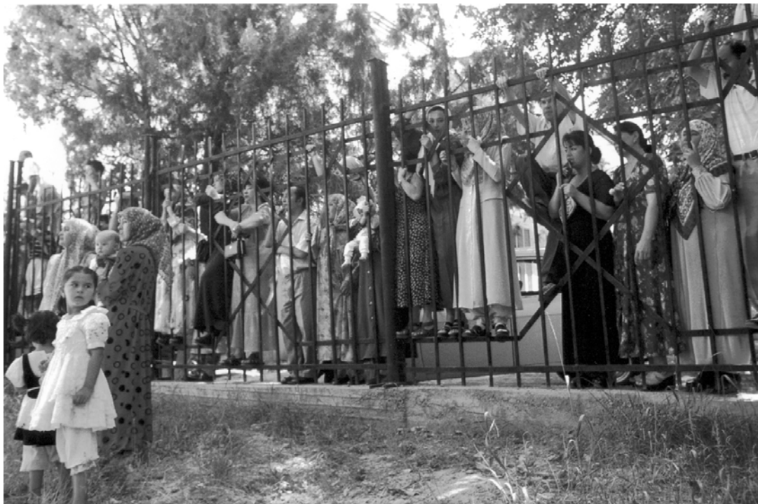
Родственники снаружи Акмал Икрамовского здания суда в ожидании увидеть своих родственников-мужчин, привлечённых к суду за религию. Ташкент.