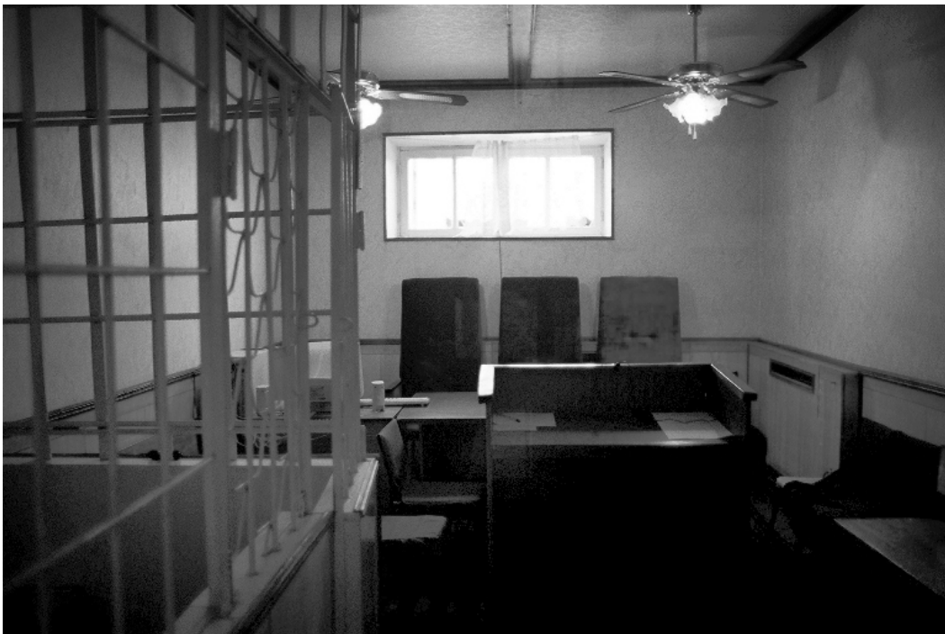
Tashkent courtroom.