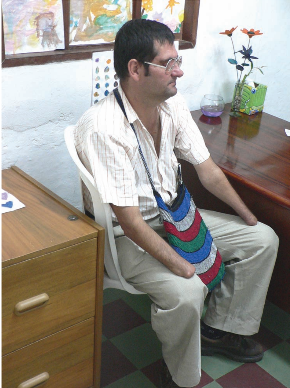
E dilberto perdió la vista en un ojo y sus manos debido a una mina terrestre. Sus heridas lo obligaron a abandonar el campo y ahora vive de la caridad pública en la ciudad.

Algunas veces, adultos activos terminan dependiendo de sus propios hijos, desarrollando depresión y sentimientos de inutilidad. “Yo vivo muriéndome,” nos dijo un agricultor, de unos cincuenta años de edad, quien perdió una pierna y casi toda su visión cuando pisó una mina antipersonal cuatro años antes. “Venía de